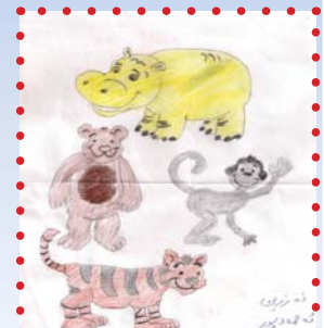
فهرزین نهحمه دپوور