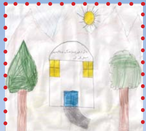
فرمیسک محهمه دپوور