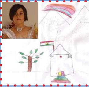
نارین که نکاش