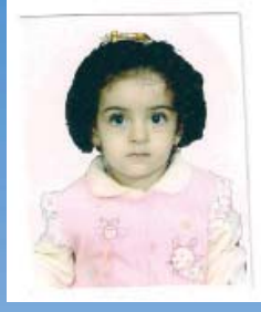
ګوردستان پور سه عید