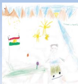
هاموون مسته فا