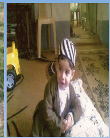
روژیار سه رد ار