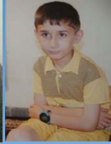
کاروان عه بیاسی