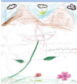
ددریا فایه ق