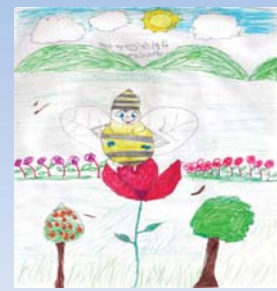
ژوان سه ده فی