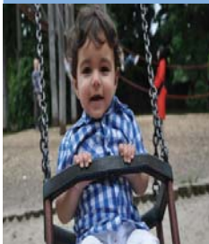
نارتین ناهه نګه ری