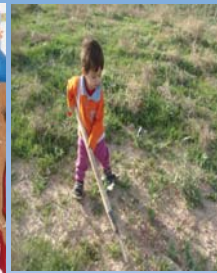
شه وګه رد باخته