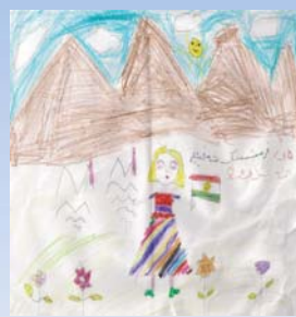
فرمتسک شه فیعی