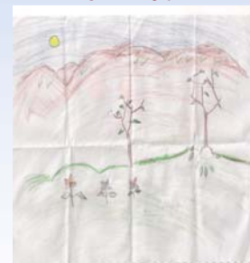
شه قایه ق نیبراهیم پور