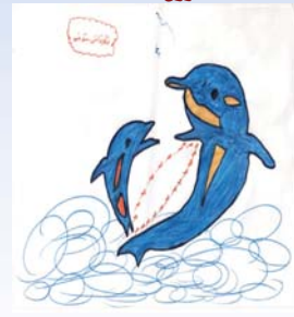
خانی سو فی