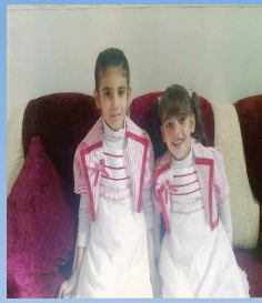
شیبیا سه رد ار و شازیار سه رباز