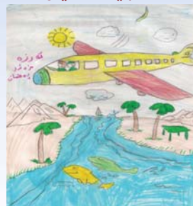
ته رزه موزه فهر