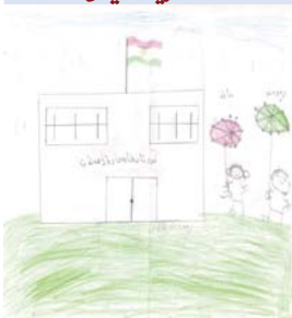
رهوهند فه لاجی