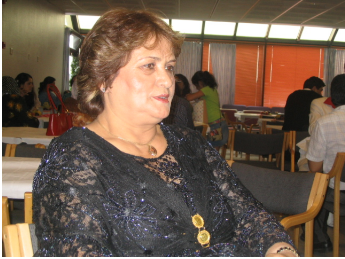
رێبه‌ری حیزبی دیموکراتی کوردستان به‌رپۆله‌چوو.

بەم بۆنەیه‌وه‌ پێشینه‌وێری رێکه‌وتی 9ی خه‌زه‌لۆهر، رێوره‌سمی پرسه‌و سه‌ره‌خۆشی له‌ یه‌کێک له‌ بنکه‌کانی سه‌ر به‌ ده‌فته‌ری سیاسی حیزبی دیموکراتی کوردستان به‌ به‌شداریی سه‌دان که‌س له‌ کاردو پێشمه‌رگه‌کان و ئەندامانی