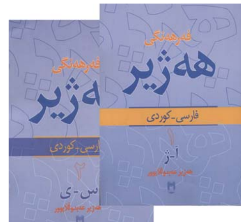
به‌م بۆنه‌یه‌وه‌ ده‌ستخۆشی و ماندوونه‌بوونی له‌ هاوکارمان هه‌زیر عه‌بدوللاپوور ده‌که‌ین. "کوردستان"

ئه‌جومه‌نی شاری لاپیزیک پاش ئه‌وه‌ وه‌سۆراخی کریستۆف گراپن - ناوێرترین دانهری کانتات له‌وه‌ سه‌رده‌مدا - که‌وت، به‌لام ئه‌ویش ئیزنی جیه‌بێشته‌نی خزمه‌تی پێ نه‌درا. باخ ئه‌گه‌رچی له‌ هه‌موو ئه‌و هه‌ورازو نشیوانه‌ی بۆ هه‌لبێژاردنی کانتۆری توماس گه‌رشه‌ گه‌رابوونه‌ پێش، ئاگادار بوو، له‌ لایه‌ن نه‌جومه‌نی شاری لاپیزیک، به‌ پێچه‌وه‌انی ویستیان، له‌ ریکه‌وتی 30 مای 1723 بۆ پله‌یه‌ هه‌لبێژدرا.