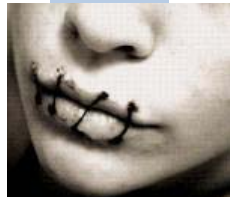
پروژ بئ سهر كهوتنی ئیرادهی پتهوتان