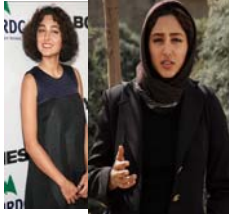
چیرۆکی حجابی زۆرهملی له ئیران و بهکهم ههنگاوهکان

له بهرهبهیری بهسترانی پهیمانی ئهمنیهتی عیراق - ئهمریکا