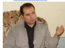
ئهم مانگرتنه بهشیک له پروژهی خهباتی مافخووازهی نهتهوهی کورد بوو