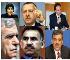
تورکیه پیوستنی به دوکلیرکه نهک ئهردوغان