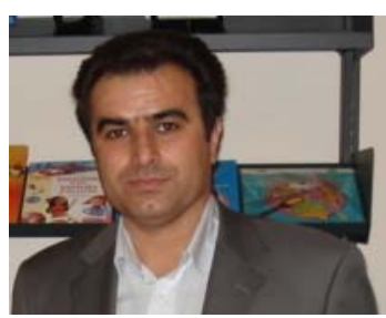
کولتوروی و کومه لایه تی تابیته ده که نه .

له کویک دا بق ولامدانه وه به په کیک سه ر به و لایه نه فیکری یه که به رگری له و تیزه نوی په یان ده کرد گوتم: که وا بوو له مه و دوا نه که ر