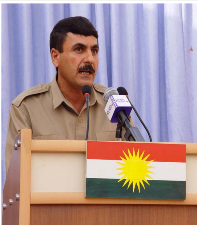
هێزیش به‌دوور نازانێ.

سه‌رکۆماری کوردستان هه‌لبژێرا. له‌و کاته‌وه تا ئیستا حیزبی دیموکراتی کوردستان وه‌ک حیزبێکی خه‌باتگێڕ و پێشکەوتنخواز و به‌رپرس له‌ ئاست پرسی نه‌ته‌وه‌یی و چاره‌نووسی گه‌له‌که‌ی، له‌ هه‌یچ فیداکاری و گیانباریه‌که‌ دره‌غی نه‌کردوه و له‌ هه‌ر دوو قۆناغی ده‌سه‌لاتداریی پاشایه‌تی و کۆماری ئیسلامی‌دا له‌ دژی ژۆرداری و مله‌پوڕی و له‌ پێناوی ئامانجه‌کانی خه‌لکی کوردستان‌دا خه‌باتی کردوه و به‌ره‌وپێش چوو و له‌م رێگایه‌دا تووشی ژۆر هه‌وراز و نشیو بووه و رۆبه‌پووی ژۆر کاره‌سات بۆته‌وه، حیزبی دیموکرات له‌ تیکشکانه‌کان‌دا ناوئۆمید و له‌ سه‌رکه‌وتنه‌کان‌دا له‌ خۆ بایی نه‌بووه. له‌و رێبازه‌دا هه‌زاران که‌س له‌ باشترین رۆله‌کانی گیانیان به‌خت کردوه، که‌ له‌ ریزی پێش‌ه‌وه‌یان‌دا رێبه‌رانی شه‌هید پێش‌ه‌وا قازی مه‌مه‌د، دوکتور قاسملوو و دوکتور شه‌ره‌فکه‌ندی دیارن.