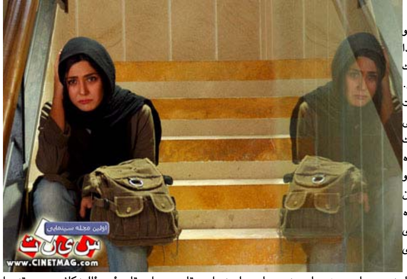
دیارو بەرچاوهو لە راستای سىستەمى پىاوسالارىدا دەپىتە پىش و كەسايەتىيە ژن ھەمووكات رۆلى نەزمتەر لە كەسايەتىيە پىاو دەبىنى. پىاوان سىماي دەسەلاتدارو سەرکەوتوو و ژنانىش لە پەراوئىز خراوو بىدەنگ دەردەكەون. ژن بە ناچارى دەبى رۆلىك يارى بكا كە پىگەى كۆمەلايەتىيە ئەو ھەر بە پلە دووىيە بىمىنىتەوھ زۆرتەر ھەستو سۆز لە خۆى نىشان دەدا تاكوو عەقل دەسەلاتى ئىران لەسەر ئەو باوھەپە ژنى باش و نمونە ئەو ژنەيەكە لە نىو بنەمالەدا دەبىنرئ و لە رۆلى دايك يا ھاوسەردا دەردەكەوئ، ئەویش ھەمووكات ھەك كەسايەتىيەكى بەكاربەر "مصرف كەندە" رۆل دەگىرئ.

خۆتان دەزانن ژن نەك ھەر لە تلویزیون دا بوونىكى سونەتییانەى ھەيە، بەلكو لە ھەموو بوارەكانى كۆمەلگە بە گشتى رۆل و پىگەيەكى شىاوو يەكسانى نىە لەگەل پىاودا، واتە بوونىكى رووھەش و بىدەسەلاتانەى ھەيە. راستە ژمارەى ژنان لە زانكۆكاندا لە پىاوانىش زۆرتىن، بەلام چونكە سىستەم ھىچكات بايەخى پىووستى بە رۆل نەخشى ژنان نەداوھ، يان ھەر ئەو ئامانجىيەتى، لە تلویزیوندا كە راگەيەنىكى گشتىيە