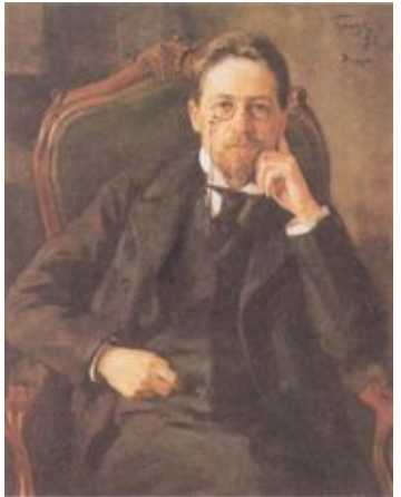
چیخوف - نانتون ۱۸۶۰-۱۹۰۴

له سالی ۱۸۸۶ هیندیک له داستانه کانی له چوارچیوه ی کتبییک دا به نیوی (داستانه رننگاو رهنکه کان) بلاو کرایه وه، سالی ۱۸۸۷ یه که مین شانتونامه ی خوی به ناوی (نه یوانوف) نویسی. سالی ۱۸۹۰ چوه دورگه ی ساخالین به رهمه ی سه فه ره که شی کتبییک بوو به ناوه وه، که نه م کتبی