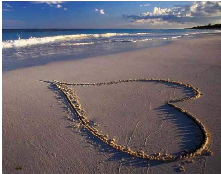
*ئەم شیعەرى شاعیری بەرێز كاك رەسول سولتانی لە ژماره ٤٨٢ى رۆژنامەى "كوردستان"دا بلاو بوویوە، بەلام بە ھۆى ھێندێك ھەلەى تایی و خرابى دا بەزاندنى شیعەرەكەمە خۆتەر بە باشى لى تەدەگەشت. ھەر بۆیە وێر داواى لىبوردن لە شاعیر رەسول سولتانی، لەم ژمارەیدا سەرلەنوێ شیعەرەكە دادەبەزێننەو.

ھۆ دایکانى جگەرگۆشە ئەنفالکراو! کانیاوی ریز، میرگی سلاو. ھۆ دایکانى جگەرگۆشە ئەنفالکراو! کانیاوی ریز، میرگی سلاو.