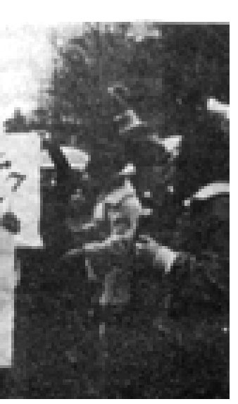
تالیان به ژناتی به شداری شانۆکه ده گوت. (بامداد، ٥٦)

(نورله دی منگنه) که یه کیک له ئه ندامانی ئه نجومه ن بوو به ریوه چوو بیتا که که شی (تیکیت) به ناوی کارتی زه ماوه نده وه راکیشراو فرۆشرا. ئیداره ی (نظمیه) ده یویست ریوره سمه که تیک بداو به کریگرانیی قسه ی ناخوش و