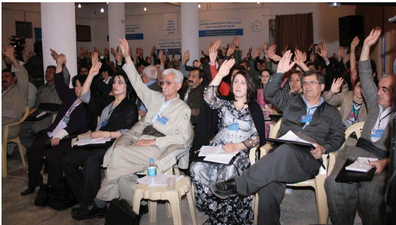
دیمه‌نێک له به‌شداریی چواره‌یه‌مین کۆنگره‌ی حیزبی دیموکراتی کوردستان