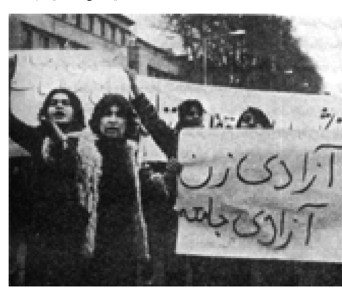
عیراق ناوه ندی فه ره نگیی ژنان به وه رگرتنی ئیزنامه له پارێزگی تاران میتینگیک نا په زایه تی له باخی گشتی (پارک) لاله پیک هینا. ئه و کۆبوونه وه یه به برپاری هیزی ئینتیزامی به جیی ئه وه ی له ده ور به ری مه له وانگه بگری بۆ شوینی ئامفی تیاتری سه ربازی پارکی لاله گوزازی وه وه له ژیر چاوه دپیری توندی پۆلیسی دا به ریوه چوو. به لام ئه و

ده یه ی ٨٠ هاتنه سه ر شه قامه کان و ره گا ژوی بۆ ئیرو زانکۆکان سالی ١٣٨١، ٨ مارس گه راپه وه شوینی راسته قینه ی خۆی واتا شه قامه کان. هاوکات له گه ل هیرشی ئه مریکا بۆ سه ر