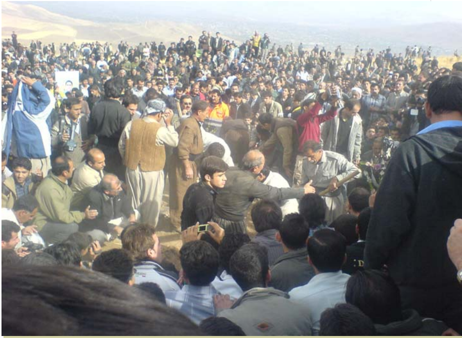
وینعی جهماره ی خه لکی شاری بۆکان و باقی شاره کانی دیکه ی رۆژه لاتی کوردستان له کاتی به خاک نه سپاردنی ته رمی موقبیل هونه رپه وه دا

کردن له حیزبی دیموکرات و تیکۆشه رانی سه باره ت به ریکه ستنی نه م کۆره، له باره ی لایه نه کانی که سایه تیی موقبیل هونه رپه ژوه بۆ به شداران دوا.