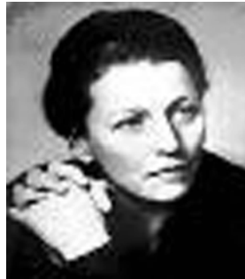
داستانی خوی لە ژێر ناوی دیاریی رۆژھەلات و رۆژئاوا نووسی و سالی ۱۹۳۰ چاپ و بۆلاری کردوہو

بەناویانگترین خەلاتئ ئەدەبی پۆلتریزی وەدەست ھینا، ھەرەھا توانی خەلاتئ ئەدەبی تۆبئ وەدەست بێنئ. بەرھەمەکانی بریتین لە: ۱- کورانی مالی بەش کراو، ۲- ھەموو پیاوان بران، ۳- دایک، داری مەرەس، ۴- خوداکانی دیکە، ۵- نەسلی ھەژدیا، ۶- خۆشەویستەکەم گەرایوہ، ۷- جیھانە شارسنایەکانی من ۸- مالی سەرۆک، ۹- فریشتەکی چینجۆ، ۱۰- دورخراوہ، ۱۱- نیشتمانپەرۆہ، ۱۲- زنی رازاوہ، ۱۳- یولان فرۆکەوانی چینی، ۱۴- داستانێ زەماوەندیک، ۱۵- بالەخانەکی کلاو فەرہنگی سەردەم، ۱۶- رۆژیکێ روون، ۱۷- پیاوانی خودا، ۱۸- داری مێژش سەرچاوہ: کتێبی (اطلاعات عمومی)