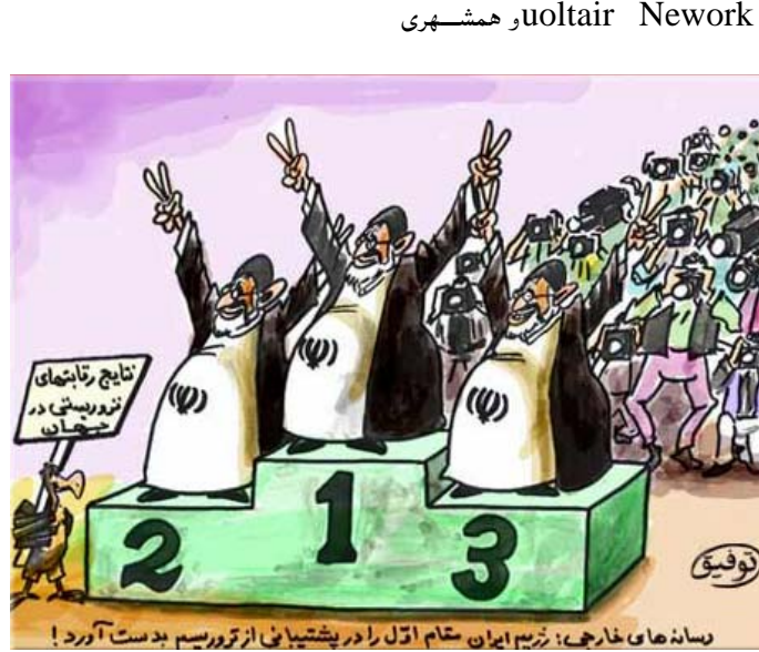
سهانه هاى خارجه: نزيه ايران مقام اول رادر پيشتياى از تروريسم بدست آورد!

ياني نه وه يه كه زور جار دهولهتان ده يانه وهى ته وه شته ي كه به لاي خويانه وه جوان و په سه ند ني ه ، ناوى تيروريزمى له سهر دابنين : وهك بزوتنه وهى سياسى يان كه ما به تيبه كان يان گروه ناچه به يه كان يان يه كينه تيبه كانى كرتكارى . نه مه يه كيك له گرفته كانى منه وهك شاره زا يه كى تايبهت له كارو بارى مافه كانى مرۆف و دژه تيروريزمدا . واته زورتيك له دهولهتانى دونيا له ماناى تيروريزم بۆ به دناو كردنى گروه گه لتيك كه نه م دهسته واژه نايانگريته وه، كه لك وهركرن. روون و ناشكرايه كه زورتيك له وولاتانه به هوى جوراوجورى سياسى، له ماناى تيروريزم بۆ به دناو كردنى نه يارانى سياسى خويان كه لك وه رده گرن و نه م كار به چهند شيويه كه بهرپوه ده چى : شيويه كه نه وه يه ته نيا كرده وه يه كى تيروريسته له لايه ن هينديك تا قم يان كه سه وه بهرپوه ده چى ، به لام دهولهت بۆ تيروريسته ناو هز كردنى بزوتنه وه يه كى بهر بلاوى سياسى و هيز و لايه نى گه وهى نه ته وه يى، بى پشت به ست به هيج بنه ما به كه لك شيويه كى ديكه نه سهر كانه يه كه دهولهتيك هه ول ددا خوى له ژير بارى تاوانى نازار و سهركوتى نه يارانى خوى ده رباز بكات و بۆ نه م مه به ست به تيروريستيان ناوزده دهكات، هه رچه نده قهت كرده وه يه كى تيروريستيان نه نجام نه داوه. نم دوو نمونه يه يهك نه ژماره به كار هينانى بهر بلاو ماناى تيروريزم دهكات سه رچاوه سايتى: uoltair Nework و هه مشهري