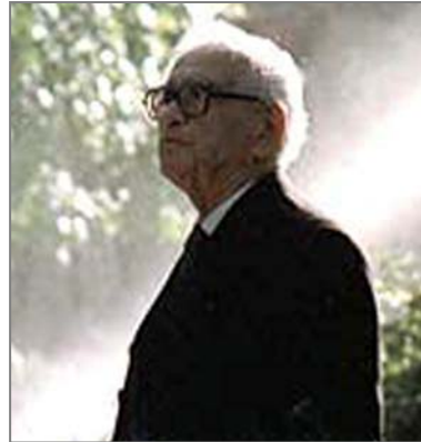
پۆل دوا کاته کانی سه عاتی خۆیندنی تیپه ره کرد که خۆیندکاریکى نورویژی

ده وه ی دوکتورا، پرسیاریکى هینایه گۆرئ: مامۆستا! ئیوه که له جیهانی سیهه م هه وه هاتوون پیم نالئی جیهانی سیهه م کوئی هه؟ به ته نیا چه ند چرتکه ی بۆ ته واو بوونی کاتی وانه خۆیندن مابوو. من له ولام دا ده موده ست شتیکم گوت که تا دئ رۆژ به رۆژ زیاتر برۆای پئ دینم. به و خۆیندکاره م گوت: جیهانی سیهه م ئه و جیگایه یه که هه ره که س بیهه وئ ولاته که ی ئاوه دان بکاته وه، مالى خۆی خراپ ده بۆ، هه ره که س بیهه وئ مالى خۆی ئاوه دان بئ، ده بی بۆ وێرانیی مه مله که ته که ی هه ول بدا.