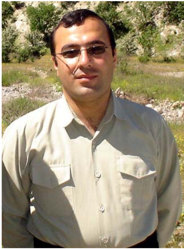
— به‌ راشكاوى‌يه‌وه‌ ده‌لێم كه شوين په‌نجەى مندالان به‌سه‌ر زۆر له‌ باب‌ه‌ت و لاپه‌ره‌كانى هه‌ر كام له‌ ژماره‌كانى دنياى مندالان‌وه‌ دياره. به‌لام تا ئىستاش وهك بۆخۆت ده‌لێى ئەوه‌ گه‌وره‌كانن كه سه‌ره‌رشتى ده‌رچوونى گۆشاره‌كه‌ ده‌كەن. هه‌لبه‌ت به‌رپۆه‌به‌رى "دنیاى مندالان" له‌ ماوه‌ى ٥ سالى رابردوودا توانيوه‌تەى كۆمه‌لێك قه‌له‌م و تواناى باشى مندالان له‌ بواره‌كانى نووسين و وه‌رگى‌ران دا بدۆزیتته‌وه‌ و په‌روه‌ده‌يان بكا. ده‌بىنين كه وا نيزك به‌ ٢ ساله "دنیاى مندالان" له‌ ژێر چاوه‌دێرى ده‌سته‌ى نووسه‌رانى خۆى دا ئاماده‌ى چاپ و بۆلۆبونه‌وه‌ ده‌بئ كه جگه‌ له‌ سه‌رنووسه‌رو هاو‌پىيه‌كى ديكه، هه‌ر هه‌موو ئەندامانى ده‌سته‌ى نووسه‌رانه‌كه‌ى مندالان خوينان. جيا له‌ ستافى نووسه‌رانى دنياى مندالان، مندالانى ديكه‌ش له‌ نيو كه‌مپه‌كانى حيزب راسته‌وخۆ له‌ شوينه‌ جياجياكانى كوردستانيش له‌ پىگه‌ى نامه‌ و ته‌نانه‌ت مندالانى كوردى نيشته‌جێى ده‌ره‌وه‌ى و لاتيش له‌ پىگه‌ى ئىمه‌يله‌وه‌ باب‌ه‌ت بۆ دنياى مندالان ده‌نێرن و هاوكارى بۆلۆكى خۆشه‌ويستى خوينان ده‌كەن.