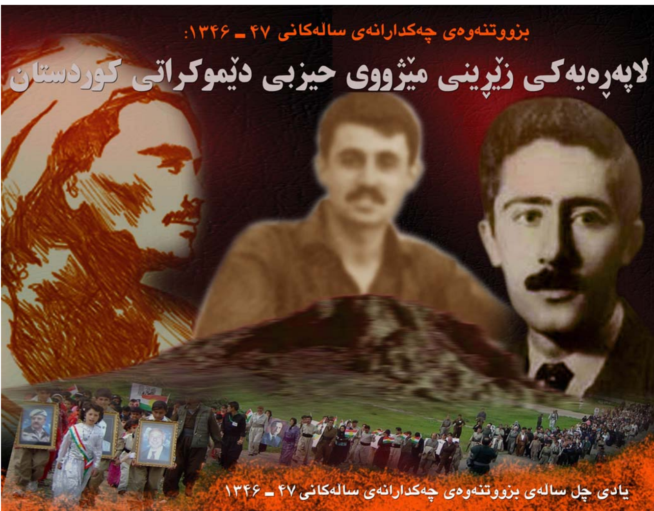
بزوتنه‌وه‌ی چه‌کدارانه‌ی ساله‌کانی ۴۷ - ۱۳۴۶: