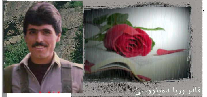
قادر وريا دەبیووسی