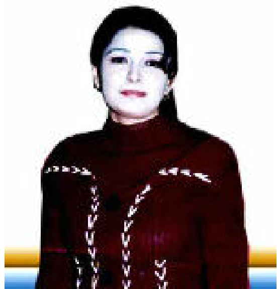
دوعا ئه‌و کچه‌ کوردی به‌ درندانه‌ترین شیوه‌ له‌سه‌ر خۆشه‌ویستی گیانی لئه‌سه‌ستیندر

مندا. له پیوهندی لهگه‌ل بالندان دا وهکوو پهره‌سئیلکه و کۆتر که زۆربه یان له نزیکي مرۆفه‌کان هیلاننه‌کانیان چی ده‌که‌ن نه‌ک چووکتترین جیاوازییه‌ک له نیوان نژیو میپیان به‌دی ناکری به‌لکوو له گشت کاره‌کاندا بۆ وینه هیلاننه کردن و کرکه‌وتنیان له سهر هئیلکه به‌ته‌واوی یارمه‌تیده‌ری به‌کترن. جیسی سهرسورمان لیره‌ دایه که ته‌نانه‌ت خه‌لکی گۆلو ته‌سک بیریش هه‌ست به جیاوازی ناکه‌ن له نیوانی نژیو میی پهره‌سئیلکه و کۆتر بالنده‌کانی دی و