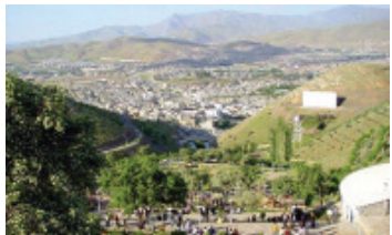
مامۆستایانی شاری سه‌ن ریه‌ره‌سه‌ی رۆژی مامۆستایان له‌ به‌رزاییه‌کانی کیوی ئاویه‌ری به‌ریوه‌ برد.

رۆژی هه‌ینی رابردوو (10 یانه‌مه‌ری 1389) کۆمه‌لێک له‌ مامۆستایانی پارێزگای سه‌ن له‌ سه‌ر بانگه‌یشتی ئه‌نجومه‌نی سینی مامۆستایانی کوردستان ریه‌ره‌سه‌ی ریزگرتن له‌ رۆژی مامۆستایان له‌ به‌رزاییه‌کانی کیوی ئاویه‌ری به‌ریوه‌ برد. له‌ سه‌ره‌تای ئه‌و ریه‌ره‌سه‌دا په‌کیک له‌ مامۆستایان ئه‌وه‌ی روونی کرده‌وه‌ که‌ مامۆستایانی پارێزگای سه‌ن وا بریار بوو سالی رابردوو له‌ رۆژی 3 ی رزه‌یر، رۆژی جیهانی مامۆستایاندا وێرای هه‌موو مامۆستایانی دنیا جێژن بگه‌ن، به‌لام کاربه‌ده‌ستانی کۆماری ئیسلامی ئیزنی به‌ریوه‌بردنی ئه‌و ریه‌ره‌سه‌یان پێ نه‌داون. له‌و ریه‌ره‌سه‌دا بریارنامه‌یه‌ک خۆیندراوه‌. له‌ سه‌ره‌تای ئه‌و بریارنامه‌یدا ها‌توه‌ که‌ ئه‌و سالی هه‌ک سالاتی رابردوو به‌ دلێکی به‌ ژان و چاوی پر فرمیسک و ده‌نگی نووساوه‌وه‌ رۆژی مامۆستایان له‌ ئێران تیه‌ر ده‌کهن. 12 یانه‌مه‌ر رۆژیه‌که‌ که‌ له‌ رۆژمه‌ره‌ فه‌رمیه‌کان دا به‌ رۆژی مامۆستا ناودیر کراوه‌، ئه‌و رۆژه‌ رۆژی که‌سانیکه‌ که‌ سه‌ر پۆله‌کانی وانه‌گرتته‌وه‌دا دنیا‌یه‌کی جوانتر و باشت له‌ سه‌ر ته‌خته‌ره‌شه‌کان بۆ منداله‌کان ده‌نوسنه‌وه‌ و به‌ به‌رده‌وامی ژیان هیواداریان ده‌کهن، به‌لام له‌ نیو دلێ خۆیان دا گرکان گه‌رکان خه‌م و ژانی تیدا ده‌بینن.