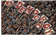
پره‌نسیبه‌ی تۆرکیه‌کانی دیموکراسی و جۆره‌کانی