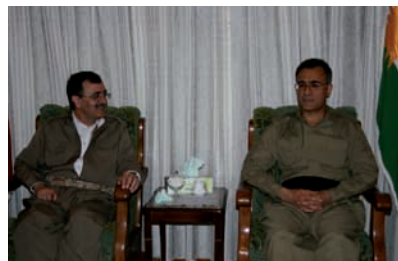
رۆژی دووشه‌مه 13 یانه‌مه‌ری هه‌یه‌تیکی حیزبی دیموکراتی کوردستان به‌ سه‌رپه‌رستی به‌ریز خالید عه‌زیزی، سکریتیری گشتی حیزبی دیموکراتی کوردستان سه‌ردانی ده‌فته‌ری سیاسیی