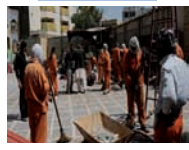
کرێکاری کورد و ئه‌و مافانه‌ی پێشان نازانی!