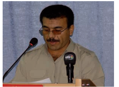
به بۆنه‌ی یادی ۱۱۲ ساله‌ی رۆژنامه‌نووسی کوردی له بنکهای

دهفته‌ری سیاسی حیزبی دیموکراتی کوردستان، له لایه‌ن رۆژنامه‌نووسان و راگه‌یه‌ندنگارانی حیزبی دیموکراتی کوردستانه‌وه رێوره‌سمیک پیک هات. به‌یانینی رۆژی پینجشهممه، ۲ بانهمه‌ر یادی ۱۱۲ ساله‌ی رۆژنامه‌نووسی کوردی به به‌شداریی دهیان رۆژنامه‌نووسی نیو ریزه‌کانی حیزبی دیموکراتی کوردستان و کۆمه‌لیک له کادرو پيشمه‌رگه‌کانی حیزبی دیموکراتی کوردستان له سالی بۆنه و رێوره‌سمه‌کانی حیزبی دیموکراتی