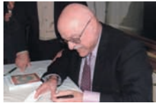
وهک گزینگه به‌به‌بانان بیه‌مان و دنیاگرین