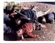
ئه‌نفال، هۆلۆکۆستی نه‌ته‌وه‌ی کورد

چوارشه‌مه 15 یانه‌مه‌ری 1389 - 2010 - 150 تمه‌ن • ئۆرگانی حیزبی دیموکراتی کوردستان