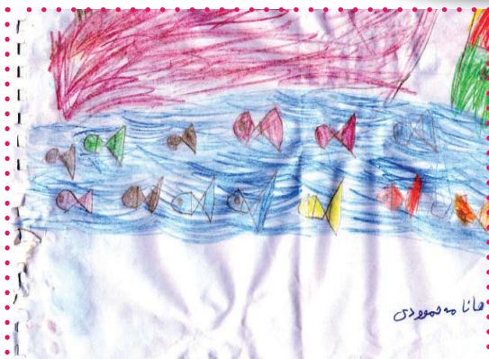
هانا مه محمودی