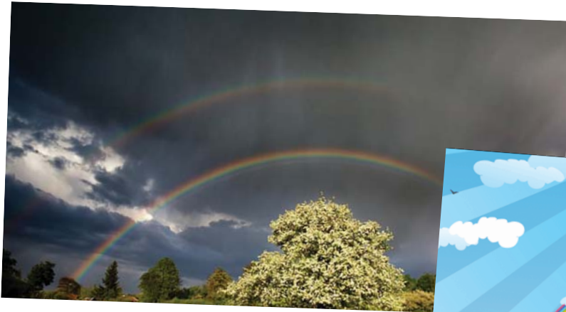
ټا: نارین که نکاش

کولکه زیږینه ش دوی باران بارین که ئاسمان پره له دلوی بچوکی ئاو، دهردهکه وی. پرووناکی خور به نیو ټهو دلوپانه دا تیده په ری و دهشکی و ټهو هوت رهنګه دروست دهن که پی پی دهگوتری کولکه زیږینه! ماوه بلین کوله که زیږینه دوو دانه یه، یه کیان به پررهنګی دهردهکه وی و ټهوی دیکه ش کاله.