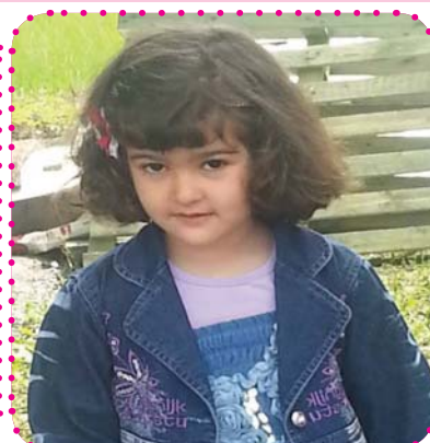
سارا ره نگینه که مان