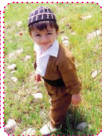
دیار چه قبین