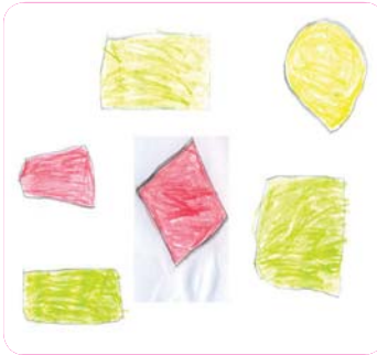
مه تین مه مهندی