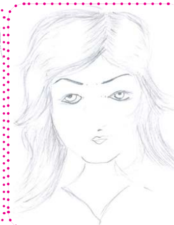
سارو جه زایرچی