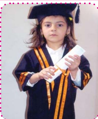
به هه شت عه لی فه قن