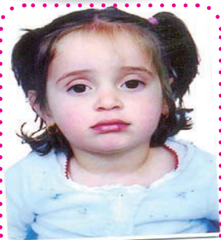
شيوه ره سول