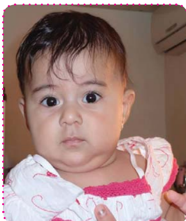
وه نه وشه کار ساز