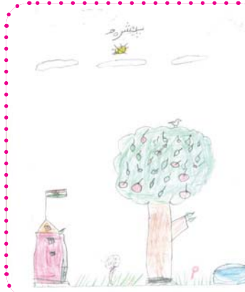
پیشره و موساپور