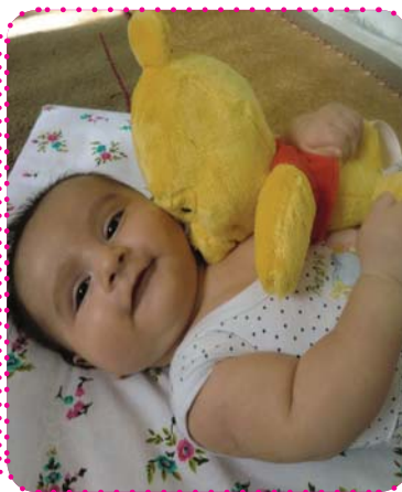
سیوهر شه ره فی