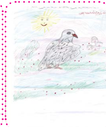
فه رزین نه حمه دی