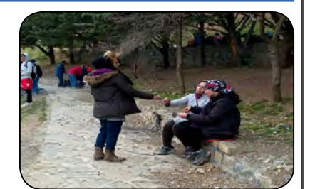
۲۵ی نوامبر، رۆژی جیهانی به‌ره‌ره‌کانی له‌گه‌ل توندوتیژی دژی ژنان بووه‌ ده‌رفه‌تیک بۆ چه‌ند چالاکی

کچان و ژنان له سه‌نه، له‌و پێوه‌ندییه‌دا ژماره‌یه‌ک له کچانی هونه‌رمه‌ندی ئەم شاره‌ پێشانگه‌یه‌کیان به‌ ناوی «هاوار» کرده‌وه که‌ بابته‌ی توندوتیژی دژی ژنانی تیندا به‌ره‌سته که‌رابوو. ئەم چالاکیه له‌لایه‌ن گروپی هونه‌رمه‌ندان «کێژان فۆتو» که‌را و ئەم کێژه هونه‌رمه‌ندانه به‌ کیشانه‌وه‌ی وینه‌ی توندوتیژی دژی ژنان ناره‌زایه‌تی خویان له‌مه‌ر به‌رده‌وامی ئەم دیاره‌یه‌ ده‌ربری. هه‌ر له‌م په‌یوه‌ندییه‌دا کۆمیته‌ی