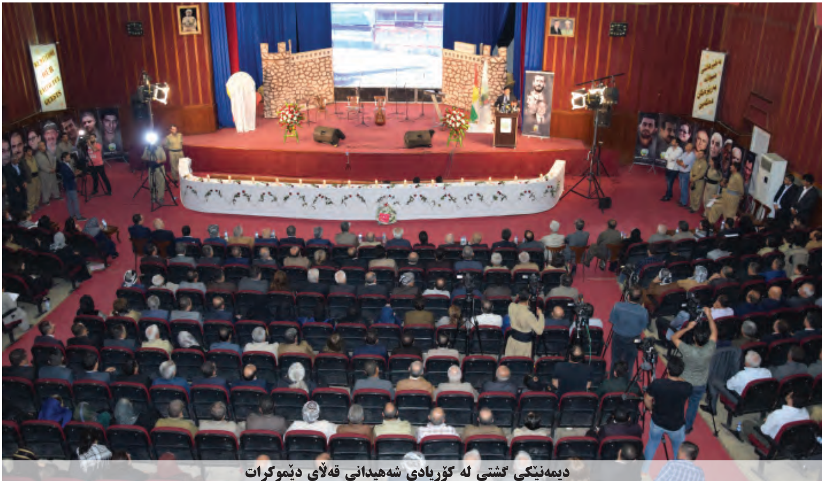
دیهمه‌نیگی گشتی له کۆریادی شه‌هیدانی قه‌لای دیموکرات