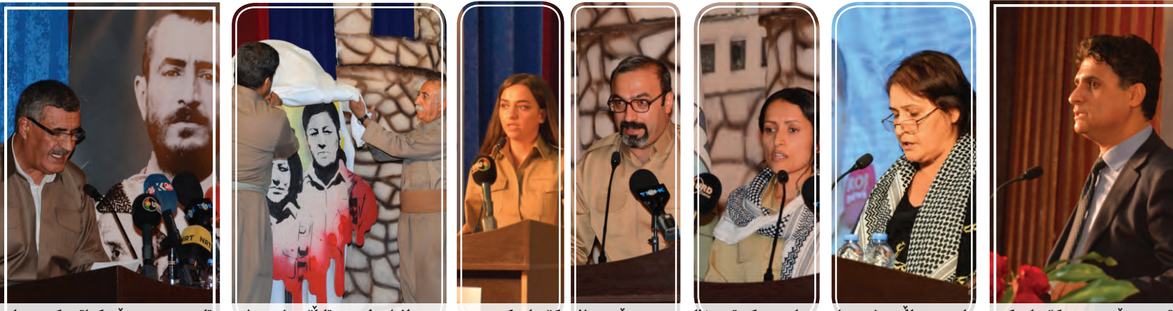
وتی به‌رێوه‌به‌ری کۆریاده‌که‌، په‌یامی بنه‌ماله‌ی شه‌هیدان، په‌یامی یه‌کیه‌تی ژنان، به‌رێوه‌به‌رانی کۆریاده‌که‌، په‌رده‌لادان له‌سه‌ر تابلۆی شه‌هیدان، وتاری حیزبی دیموکراتی کوردستان