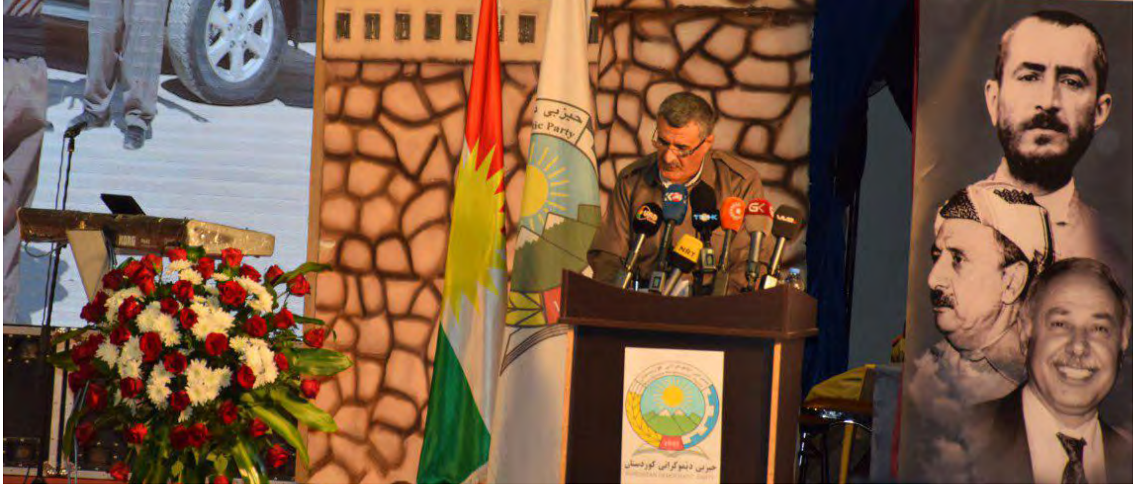
ھاوئىشتامانىانى خۆشەويست! مىوانە بەرپىزەكان!

(دەقى وتارى سكرتېرى گشتىيى حىزبى دېموكراتى كوردستان لە كۆريادى شەھيدانى ۱۷ى خەرماناندا)