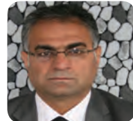
پیشەرگە مەندیل سبیهەکان ۸/