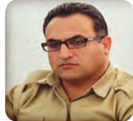
دیالۆگی پەختەگراوە و گۆرینی پەختاری رێژیم ۵/...