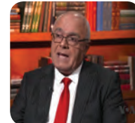
دەمانەوی حیزبەگەمان قەسە گۆنایی بکا ۶/...