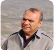
قاسملوو وەک هێمایەک ۵/