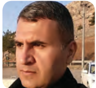
میژوو و رابردوو یەک نین ۷/