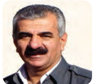
لە تاوانی قیەن هەتا بریاری میکونوس ۴/