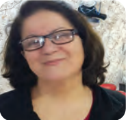
فیئیمینیزم، یاسا و شەریعت ۱۰/