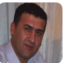
ئومید لە گەمەى سیاسەتدا / ۱۰