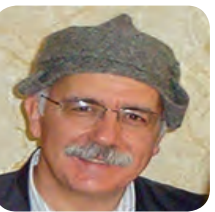
ھەوراز و نشیوھەکانی بزووتنەوێ کورد / ۷