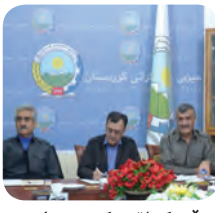
حیزی دیموکراتی کوردستان و ناوھندی ھاوکاری حیزبەکان / ۴