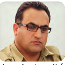
لێنگرێدانی بەرزەوھندی ھاوھەش و رەفتاری بەگرتووانی کۆمەلگە / ۵