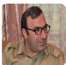
بەرجامی بێ ئەنجام / ۲

کاربەدەستیکی وەزارەتى خویندن و پەرورەدى ئێران دەلى لە سالی خویندنى ئەمساڵدا (۹۶_۹۷) لانیكەم ۱۴۲ ھەزار مندال لە خویندن داپراون. ریزوان ھەکیمزادە، بریکاری وەزیری پەرورەدى ئێران وێرای راگەیاندى ئەم ئامارە دەلى: لە ئیستادا لە ئێران ۳ ملیون و ۲۰۰ ھەزار مندال ھەن کە وازیان لە خویندن ھیناوە و زۆرینەى ئەو مندالانە ئى پاریزگا ھەژار، بێبەش و پەراویزخراوەکانی ولاتن. کورستان وەک ناوچەپەکی پەراویزخراو لە نەخویندەوار ھیشتەوھشدا پشکی شیرى پێ دەبێ. ئامارە دەولەتیەکان دەلین: پاریزگای سنە زیاتر لە ۲۸۶ ھەزار نەخویندەواری بەتەواو مانا و ۲۶۲ ھەزار کەسى کەمەسەوادی ھەپە و لە ئیستادا پتر لە ۳۰۰ ھەزار کەس لە شار و ناوچەکانی پاریزگای کرمانشان نەخویندەوارن. ھەر وھا لە پاریزگای ورمى ۱۸۳ ھەزار کەس و لە پاریزگای بچوکی ئیلامیشدا ۳۰ ھەزار کەس بە تەواوی نەخویندەوارن.