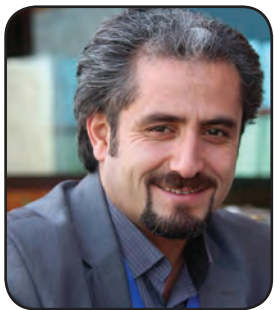
عەلی لە یلاخ