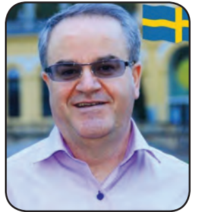
فارین پالیسی - جوست هیلته‌رمهن و: که‌مال حه‌سه‌نپوور