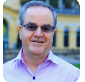
جە‌ی‌سالۆمۆن * و:که‌مال‌حه‌سه‌نپوور

له‌گه‌ل‌کیم‌بوو، سه‌رۆکی‌ئاژانسی‌وزهی‌ئه‌تومی‌فه‌ره‌یدون‌عه‌بباس‌ده‌وانی‌بوو، که‌واشینگتون‌و‌نه‌ته‌وه‌یه‌کگرتوه‌کان‌به‌هۆ‌ده‌وری‌ناوبراو‌له‌گه‌شه‌پیدانی‌چه‌کی‌ناوکی‌ئابلوقه‌یان‌به‌سه‌ر‌دا‌سه‌پاندوه. به‌هه‌مان‌شینه‌وه، به‌گویره‌ی‌میدیای‌کۆره‌ی‌باکوور‌و‌ئیران‌دوایین‌سه‌فه‌ری‌کیم‌جه‌ختی‌له‌سه‌ر‌شتی‌زیاتر‌له‌پشتیوانیی‌له‌روحانی‌کردوه. کیم‌و‌جیگری‌وه‌زیری‌کاروباری‌ده‌روه‌چو‌هویچول، بالوێزخانه‌ی‌نویی‌کۆره‌ی‌باکووریشیان‌له‌تاران، سه‌مبولی‌قوولتربوونی‌په‌یوه‌ندییه‌کانی‌نیوان‌ئه‌و‌دوو‌ده‌وله‌ته، کرده‌وه. ئه‌وان‌هه‌روه‌ها‌به‌شدارییان‌له‌زنجیره‌یه‌ک‌کۆبوونه‌وه‌ی‌دووقولی‌له‌گه‌ل‌په‌یرانی‌بیانی‌کرد‌که‌زۆربه‌یان‌ولاتانیک‌که‌کرپاری‌مه‌زنی‌چه‌کوچۆلی‌کۆره‌ی‌باکوور‌له‌ده‌یه‌کانی‌رابدروو‌بوون‌(بۆ‌ویته‌زیمبابووی، کوبا، کوماری‌دیموکراتیکی‌کۆنگۆ‌و‌نامیبیا). به‌ریوه‌به‌رایه‌تی‌ترامپ‌زه‌ختی‌سیاسی‌له‌سه‌ر‌ئه‌و‌ولاتانه‌