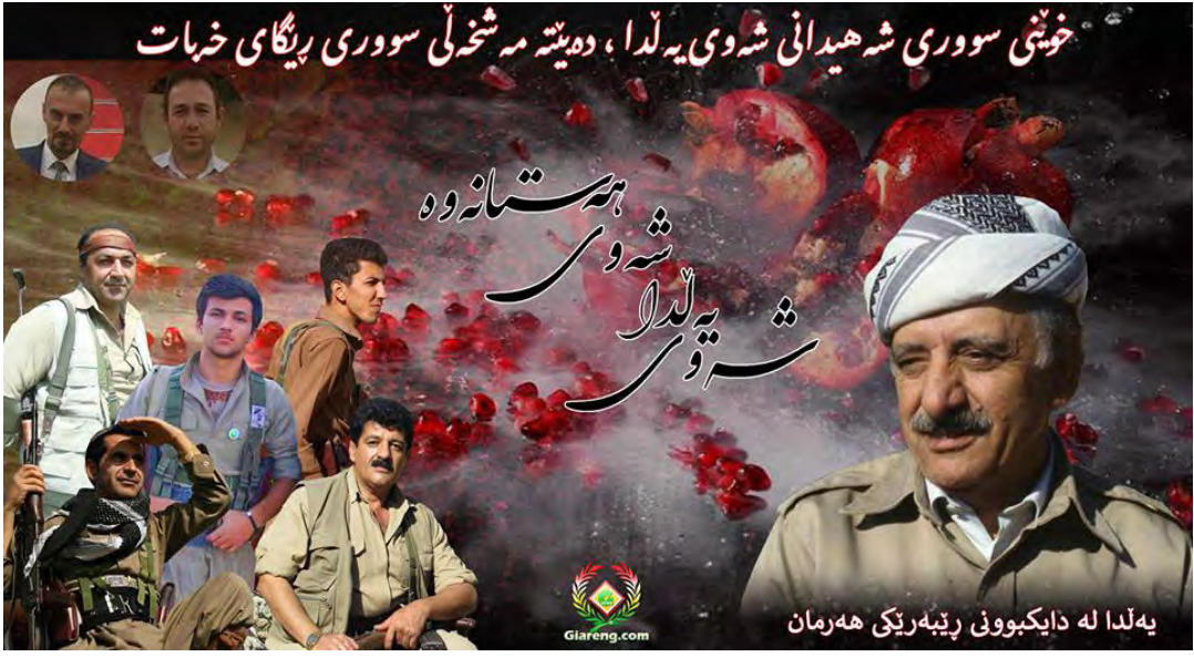
په‌لدا له‌ دایکبوونی رێبه‌ریک هه‌رمان