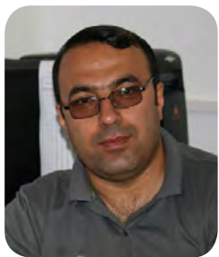
عه لی بداغی

له بودجه ی پیشنیاری ده ولت په سند بکا نرخی نان زیاتر له دوو هینده ی ئیستا گرانتر ده بی و خه لکیکی زۆر هه ر ئەو نانه ویشکه یان بۆ ناکردی.