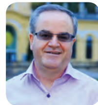
ناشال ریڤیو - سیت جەوی فرانتزمن کەمال حەسەنپوور