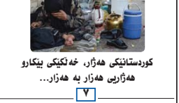
کوردستانیکی هه‌زار، خه‌لکیکی بیکارو هه‌زاری هه‌زار به‌ هه‌زار...