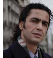
شه‌ها به‌دین شیخی