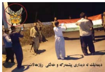
دیه یه لک له دیداری پیشمه ره و خه لکی روژهه لات

قسه ی بو خه لکه که کرد. نه ئه مانه ی ره به ری حیزبی دیموکراتی کوردستان، ویزی راگه یانندی سیاسی خۆی و هاورپایی له پیشواری و هه لویستی شوپشگیرانه و نیشتمانپه روه رانه ی خه لک، دلنایی پیدان که هیزی پیشمه ره گه ی حیزبی دیموکراتی کوردستان لی براوه جار به جار و سال به سال جووزویکی کاریگه رتریان له نیو خه لک و نیشتمانی خویمان دا هه بی. ئهم ناواته دیزینه ی خه لک و پیشمه ره گه ش ته نیا به هاوکاری و پشتیوانی هه چی بویره تری خه لک