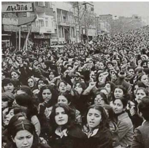
لهم گوتاری ناسیۆنالیزمدا ژن به‌شوناسی خۆی، وه‌ک تاکیکێ ئازاد بوونی نییه‌، به‌لکه‌و ژن یان

اشکاوێ دزایه‌تی ژنان ده‌کات، له‌ دابه‌شکردنیک گشتیی ئیوان گوتاره‌ رۆشنیری و سیاسیه‌کانی کورده‌واریدا، ده‌توانین ئه‌م چوار گوتاره‌ به‌هه‌ر چه‌سته‌تر له‌ هه‌مان بیه‌ین: گوتاری ناسیۆنالیستی کوردی له‌م گوتاره‌دا کێشه‌ی له‌م کورد کێشه‌یه‌کی نه‌ته‌وه‌یه‌ی و لا‌تیاریزانه‌یه‌، واته‌ کورد له‌ به‌ر کوردبوون دژی هه‌لاوردنیک بووه‌ته‌وه‌ که له‌ لایه‌ن ئه‌وپه‌رته‌گانه‌وه‌ کراوه‌، وه‌ک عه‌رب و فارس و ئه‌نگه‌ری. هه‌روه‌ها واته‌ که‌یه‌ هه‌شتا له‌ رۆژگاری کۆلۆنیاڵیزمی پاشماوه‌ی ئه‌په‌راتۆریه‌کاندا ماوه‌ته‌وه‌ و تا ئێستا نه‌ کورد خۆی تانویه‌تی مافه‌ ره‌واکانی خۆی وه‌رگریته‌ و نه‌ ده‌توانیوه‌ له‌ به‌رانه‌رکێشی وه‌ها شیواژیکه‌ی بیه‌ت به‌ هۆی گه‌رانه‌وه‌ی مافه‌کان بۆ کورد و پاراستن. له‌ پێناسه‌ی گوتاری ناسیۆنالیستی کوردیدا، مرفۆی کورد که‌سیکه‌ که پارێزه‌ر و تیکۆشه‌ری رێگه‌ی به‌یه‌په‌تان و تیکۆشانی ناسنامه‌ی کوردیه‌، واته‌ ولا‌تپارێزی و نه‌ته‌وه‌ و زمان پارێزی و ئیتر به‌مجۆره‌ ... له‌م گوتاره‌دا جیاوازییه‌کی ئه‌وتۆ بۆ ناسنامه‌ی رهنه‌گه‌زی له‌ به‌رچاوا ناکه‌یردیت و وه‌کو هه‌موو گوتاره‌ ناسیۆنالیستیه‌کانی تری دونه‌یا، مرفۆ به‌ پێوه‌ری «پیاویکی هیتۆسیکسوال» ده‌نرخێزیت. ته‌نانه‌ت ئه‌گه‌ر ئه‌وه‌یه‌ که خۆی کوردی ئه‌و ره‌وایه‌ بده‌ به‌ خۆی که ناسیۆنالیزمیک هه‌ر شه‌که‌ر نییه‌، به‌لکه‌و ناسیۆنالیزمیک به‌رگریکاره‌، له‌ شه‌وه‌ی کانی رووبه‌روبوونه‌وه‌ی له‌گه‌ڵ ناسنامه‌کانی دیکه‌ی کۆمه‌لگه‌، وه‌ک ژنان، هۆمۆسیکسواله‌کان، چین و توێژه‌ ئاسووری و کۆمه‌لایه‌تیه‌کان و ته‌نانه‌ت ناوین و مه‌زه‌ب و دیالیکته‌ جیاوازه‌کاندا