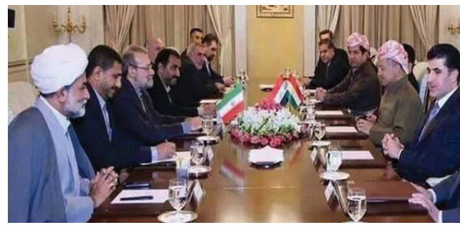
ئهو ناهاوسه‌نگیه‌ی سیاسییه‌ی که له‌ ناکامی چۆنییه‌تی هه‌لسوکه‌وتی لایه‌نه سیاسییه‌کانی باشووری کوردستان و کۆماری ئیسلامی هاووته‌ی، هه‌ر به‌ ته‌نیا به‌ زبانی هه‌ریمی کوردستان نه‌شکاوته‌وه، به‌لکوو به‌ زبانی جوولانه‌وه‌ی کورد له‌ رۆژه‌لاتی کوردستانیش ته‌واو بووه

چاوه‌روان ده‌کرا که پێوهندی کۆماری ئیسلامی ده‌گه‌ل لایه‌نه سیاسییه‌کان، جیکای خۆی بدا به پێوهندی نێوان حکومه‌ته‌کانی هه‌ریم و کۆماری ئیسلامی. به‌لام به‌پێچه‌وانه هه‌لسوکه‌وتی لایه‌نه سیاسییه‌کانی هه‌ریم به‌شێوه‌ی گه‌رموگورتر له‌رابردو ده‌گه‌ل رێژی تاران به‌رده‌وامبوو و هااته‌ کایه‌ی حکومه‌تی هه‌ریم نه‌یتوانی سبیه‌ر بخاته سه‌ر ئاستی پێوهندی لایه‌نه سیاسییه‌کانی باشوور ده‌گه‌ل رێژی تاران . هۆکاری ئه‌وه‌ش بۆخاستو ئێراده‌ی دوولایه‌نه، وانا کۆماری ئیسلامی و لایه‌نه سیاسییه‌کانی باشوور ده‌گه‌رایه‌وه، که یه‌که‌میان ره‌جای ستراتیژی کۆماری ئیسلامی سه‌باره‌ت یه‌که‌پارچه‌یی خاکی عێراق، دووه‌میان ره‌جای به‌زوه‌ده‌نی بالای حیزبی له‌سه‌ر بناغه‌ی ده‌که‌به‌رایه‌تی سیاسی. هه‌ریوه‌ی له‌سه‌ره‌تای دامه‌زرانی حکومه‌تی هه‌ریم، پێوهندی سیاسی، ئابووری و ته‌نانه‌ت کۆله‌ریه‌کانی نێوان هه‌ریم و کۆماری ئیسلامی به‌ شێوه‌ی سه‌فت و لاسه‌نگ و له‌ایه‌ک بوو. به‌ومانایه‌ ئه‌وه‌ندی ئه‌وپه‌وه‌نیه‌ی سوودیان بۆکۆماری ئیسلامی هه‌بوو، یه‌ک له‌سه‌دی ئه‌وه،