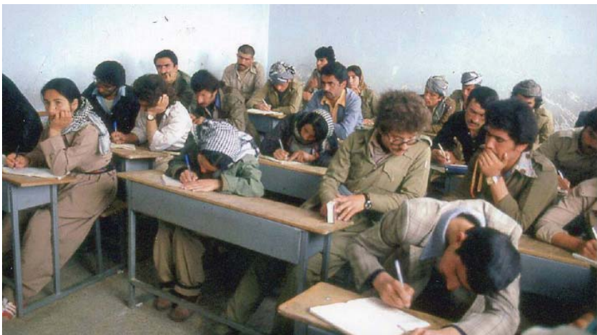
هه‌نووکه کۆمه‌نگه‌ی کوردی له‌ رۆژه‌لاتی کوردستان، وه‌کوو ناوچه‌کانی دیکه‌ی رۆژه‌لاتی نا‌فین پیناسه‌یه‌کی روون و ئاشکرای بۆ دۆخی ئیده‌ئال و دن‌خوای داها‌تووی ژن نییه و فه‌زای مه‌جازیش، یه‌کیکه له‌و هۆکارانه و ره‌نگه‌ گرنگترین هۆکاریش بێ که ژۆر خیرا بایه‌خ و سه‌رچه‌شنه‌کانی ژنان ده‌گۆرێ

ژۆر به‌ربه‌رین له‌ فه‌زای مه‌جازی‌دا دینته‌گۆری و ره‌نگدانه‌وه‌کانی له‌ ژیا‌نی رۆژانه‌دا به‌رده‌وام له‌ گه‌شه‌ دا‌یه. کارکردی بزوتنه‌وه‌ی کوردی به‌رانه‌ر ئه‌م چه‌شنه‌ پرسیارانه‌ی کۆمه‌لگه، به‌تایبه‌ت توێژی ژنان، وه‌ک پێوه‌ریک کورد چۆنا‌وچۆن ده‌توانی پێوه‌ندییه‌کی دوولایه‌نه ده‌گه‌ل ئه‌و ئه‌و ژن و پیا‌وانه دابه‌زرینی که خه‌بات بۆ نه‌هێشتنی هه‌لاوردنی جنسی ده‌که‌ن و تیچووی بنی کۆمه‌لگه‌ی کوردی به‌ره‌و لایه‌ک ده‌کشێ که شوناسی کوردی که یه‌کیکه