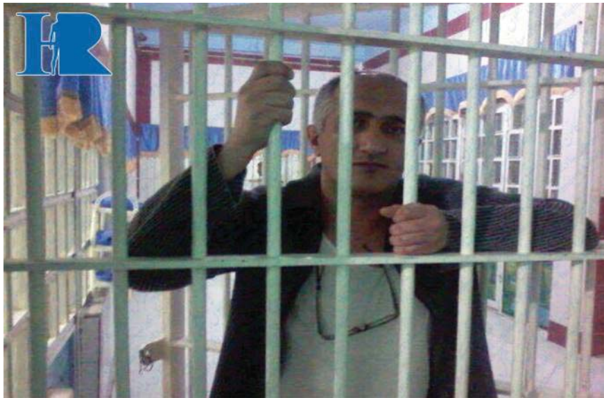
دەیان جار بە بۆنەى رووت كردنەوهمان و دەرهێنانى جلوبەرگی زیندانبیەكان و تەنانهت شۆرت و تیشیرتی ئەوانەوه، لەگەڵ ئەو كارمەندانە تیکهه ئچووین و لە كۆتاییدا توشى شۆكى كارەبابى، باتۆم و ژوورى تاكەكەسى ھاتووین

مادە هوشبەرەكانەوه هەیه و زۆربەى تاوانباران بە جۆرى لە جۆرەكان توشى مادە هوشبەرەكان بوون و بە هۆى ئەدارى و بێكارى یەوه لەم شارەدا دزى كردن پلەى دووھەمى رژێمى دیلەكانى لەم زیندانەدا (هەیه) لەوه ناخۆشتر و كێشەى ھەرە گەورەى ئیمە بە هۆى ھاوبەندى بوون لە گەڵ ئەم تاوانبارانە، پشكینی پەیتا پەیتا ئیمە بە بیانووى بەرپرسیانى زیندانەوه بە بیانووى دۆزینەوى مادە هوشبەرەكانەوه، چەند رۆژو جارى لە كۆتوپردا خەلكى زۆرى كارمەندەكانى بەندىخانە بە باتۆم و شۆكى كارەبابى یەوه دیتە بەشەكەى ئیمە و دێچە ناو ژوورەكانى نووستن و بە بیانووى دۆزینەوى ئەفییون،