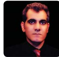
نووسین: نارهش نۆرستانی وهرکێران: ئاله‌شین