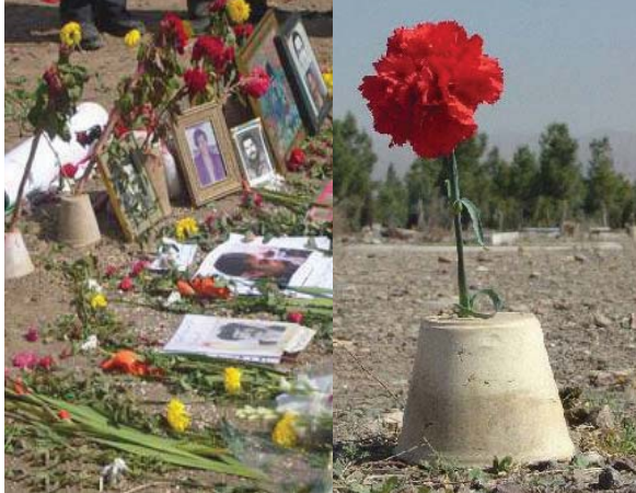
ئ‌یره «خاوه‌ران» ه‌! گۆرستان‌ی ب‌ینا‌وینشانی هه‌زاران زیندانیی سیاسیی ئ‌یران که‌ سالی ۱۳۶۷ له‌ لایه‌ن رژیمی کوماری ن‌سلامییه‌وه‌ ئ‌یعدام ک‌ران و به‌ کۆمه‌ل کۆمه‌ل خرا‌نه ژ‌ر خا‌که‌وه‌.

له‌ به‌ش‌یکی دیکه‌ی راپۆرتی سیاسییادا بارودوخ‌ی پارچه‌کانی کوردستان و له‌نیو واندا به‌تایه‌به‌تی قه‌یرانی سیاسي و ده‌ستووری ن‌ستای هه‌ریمی کوردستان و ه‌یروا و چاره‌روانیی ده‌رچوونی په‌که‌رتوانه‌ی سه‌رک‌رایه‌تی و دامه‌زراوه‌ سیاسیه‌یی‌کانی هه‌رم ئه‌و قه‌یرانه‌ و هه‌روه‌ها مه‌سه‌له‌ی ده‌س‌تیگرده‌وه‌ی شه‌ر له‌ باکووری کوردستان و ئاکامه‌ زاینه‌بخشه‌کانی ئه‌م ده‌وره‌ ن‌ویه‌ له‌ گ‌رژێ بۆ شانسه‌کانی بره‌نه‌ پ‌یش و چاره‌سه‌ری پ‌رسی کورد له‌ تۆرکیه‌ که‌وتنه‌ به‌ریاس.