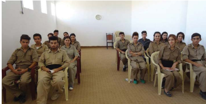
ده‌سته‌به‌ربوونی مافی ژن و سرینه‌وه‌ی هه‌لاوردن دژی ژن، یه‌کیکه له‌ گرنگترین بنه‌ما و پێوه‌ره‌کانی کۆمه‌نگه‌یه‌کی دیموکراتیک که پارتیه کوردیه‌یه‌کان به‌تایبه‌ت حیزبی دیموکراتی کوردستان سالانێکه هه‌ول بۆ چه‌سپاندنی ده‌دا

بۆ هه‌سه‌نگاندنی دیموکراتیک بوونی بزوتنه‌وه و یا نا‌کارامه‌یی بزوتنه‌وه‌له به‌رچاو ده‌گیرێ. که‌واته بزافی کوردی بۆ به‌ره‌وپیش بردنی خه‌بات ناچاره ژۆر به‌هێز و ئه‌کتیفا‌نه‌ گرنگی تایبه‌ت به‌ پرسی ژن و نه‌هێشتنی هه‌لاوردن دژی ژنان بدا و به‌ به‌رنامه‌ریژی دروست و گونجاو که و لام‌سه‌ری