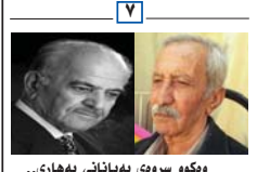
و دکو سه ری به یانانی به هاری..