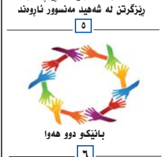
باتیکو دوو هه وا