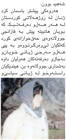
پیشمه رگایهتی دا بهشاردیان کردیوه لهو ریگه یهیدا ههموو جۆر کوله مرگه یهکیان قه بوول کردوه، بچگه له وه و هک پيشمه رگایهتیان و نهکی پيشمه رگایهتیان بهرینوه ببردوه، له ژور قوتاغدا بۆ مندا له کانیان هم دایک بوون و هم بابو ئه کی پروده ده بوون و نهانته به خپوکر دینشان که وتوته سه رشان و به شیکه یی که له ژنان له نیو شارو گونده کانی کوردستان له هه لومهر چی ژور سخت و دژواردا هاویری یاره تهی ده ری پيشمه رگه ی کهسانی سیاسی بوون و گه لیک جار وه نه دنیان مایه له خۆ داناهه که بۆته هوی گرتن و تهانته ئیعدام کردنی شان.