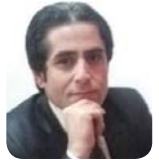
عەلی لە بیلاخ