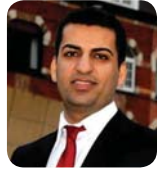
ناگري باله کي

رپورٽي ٺاڙاسي فرانس پريس: ٽماري به شداربواني ميٽنگي مهاباد زيات له ۲۰۰ هزار کس به لهراسٽي دا ٺه ميٽنگي زيات وک ريفرانڊوميک دهچو بؤ حيزي ديموکرات، حيزيک که ۲۲ سال له خباتي نپتي دابوو، رڙي ۱۶۱ رشهسمه خهلي رڙهلاتي کوردستان «بلي» يان به حيزي ديموکرات گوت و حيزي ديموکراتيان وک نونيري خويان هليڙار.