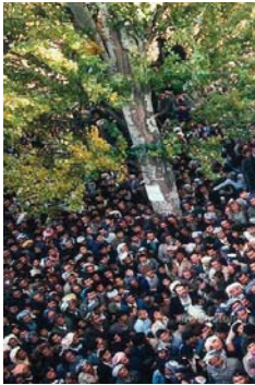
ٺير کونٽرولي نيزامي خوي، له کيتبي قاسملوي کوردان دا کارول پوهنپويه له زماني شهيد د. قاسملوه ناوا ياس له دوو رڙو پيش ريفرانڊوم دهکات: دوو رڙو پيش ريفرانڊوم، قاسملو چوو بؤ شاري قوم، داواي دانيشتي دهگل خوميني کرد، ٽماره يک له ٺه ندمانتي ريبيري حيزيبي دهگل بون. قاسملو ده ي گيرايه: «کاتنگ ٺه وڙور کوهين، بهسندان ٺو مندالمان له وه دهکي خوميني چاو پي کوهين، ٺايتوللا له کاتنگا له سر زهي دانيشتي و قاچه کاني تيک به زانديبون، کلو قه نديکي هال دهگرتو ده زاري دهناو دوايهش ديري دنيايه وه دهيدا به يه کيک

له ريفرانڊوم دهنگان به کوماري ٽيسلامي بي راگه ياند به مهرجه داخاوه کاتنگان دابن بکرين»، له حالیکه سري شور کردبووه گوتي: «ٺه وه کارى من ٺه»، بي ٺه وه چاوم لي بکا گوتي: «بؤ بازرگاني بيته»، بهرتهرت ٺاهاڙي بهو پيشنباري کرد که پاش رووداوه کاني سنه درابون و گوتي: «ٺايتوللا تاله قاني پيشتر راگه يندراويکي بلاو کردوتوه وه، له وه زياتر چتان ده ي»، سه رله ي پيم له سه ر قسه کاني خوم ډاگرتو گوت که واوبو کاتنگ ليژه چومه دهر ٺيه ريگم بي ده دن به راشکاري راگه يک به ٺيه دهگل ٺه پرسانه هه ن که تاله قاني به بليني بي دابون؟»