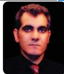
نارهش لورستاني و: نالهش