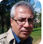
ٺازاد که ريمي

له سيميتراني «ٺيران، ناوبانگ، گه لو نيشتمان» دا جيگري ٺايتيه ي سه روک کوماري ٺيران بؤ کاروياري قومه کانو که ميه تيه ٺاينيو مزه ه يه بيانه باسي ٺه وه دهکات که «عيراقو ٺه هر له سنوري شارستانيه تي ٺيه دايه، دياره که سايه ي شوناس، فره هنگ، ناوه نديو پايتختي ٺيه شه»، له به شيکي ديکي قسه کاني دا ٺاهاڙي به وه دا گوايه «ٺيمپراتوري ٺيران که پايتخته که به دغا هو ديسان ٺياوه توه»، ٺه م باه ته هه م بي ٺوروي هه م ٺه دوني، له بهر ٺه وه ي جوگرافياي ٺيران قهت هه ناوه شيته وه، که واته يان ده ي پيگه شهي به کين يان ده ي پيگه هه سبازين و يک بکرين». دهر بيري ٺه وشانه له زاري راويگرتاري سه روک کوماري ٺيران بؤ کاروياري که ميه تيه ته وه ويو ٺاينبي و مزه ه يه يکي ٺيران، دهکنو هه راي هه م له ناو ٺيران وه هه م له ولاتاني رڙه لاتي ناوه راسٽ وک ميسر، تورکيا، سعوي و ته نانه عيراقيش بهر پيا کرد بؤ ويته ۲۱ نونيري پارلماني ٺيران له نامه يکدا و ٺاراسٽي سه روک کوماري ٺيرانان کروه هوشداري ده دننه روحاي که گوايه ٺه قسائيه اعلى يوسى به ٺاراسٽي سه يه دوزمناني کوماري ٽيسلامي دا رويش توه، و اچه نده ساله خهريک