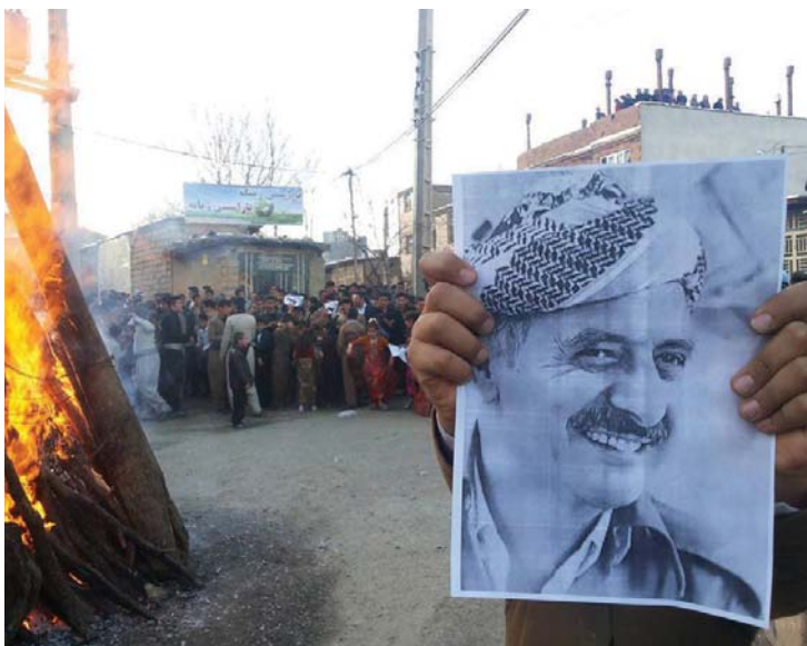
پارته كوردستانپه كان به ميديكان و ههروهه له ريگه ريگه ستي نيني ئيوخوى ولاته وه و ئه و كوردانى له شاره كانى ديكي ئيران ده زين و ههروهه له ريگه ريگه ستي ئاشكارى ده روه ي ئيران؛ هه ميشه به جوريك هه ولى زيندوو راگرتنى بزوتنه وه و زانبارى گه ياندنى بپسانه وه ده دا

چهنه ساليكه ده بينين هه نديك كه س له ميكاندا، حزبه كوردپيه كان و به تايه ت حيزبي ديموكراتي كوردستان تاوانبار به كه مكارى و لاوازي ده گه ن؛ به لام له راستيا ئه وه بو چپيه؟ چون و به چ پيوه و پيوانكيك ده توانين بگه ين به ئاكاميكي راست و دروست و لوژيكيانه و دادورپيه كي دا په روه رانه؟