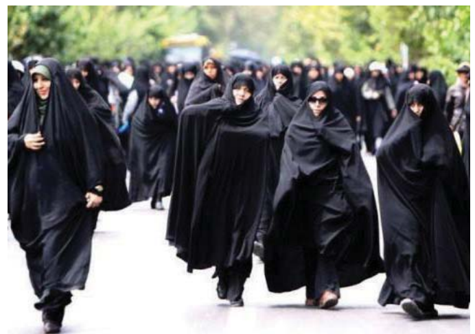
ئەگەر کۆمەڵگای ئەوروژی ئێران بیهوئ وەک کۆمەڵگایێکی پیشکەوتوو له دنیای ئیستادا بەدیار بکەوئ پیویستە له رۆلو نەقشی ژن غافل نەبێو له هەموو بواردەکانی ژانی دا ئەو نیماکانە بۆ ژنان برەخسێ که له کارو چالاکیه زانستی وکۆمەڵایەتیەکاندا بەشدارین

لێرهدا چەند نمونەیک له گێرگرفتو بی سەرەو بەرەیانە باس دەکەین. راکرتنی بەرنامە ی تەنزیم خانەوادە یەکێک له نموونەیه که زیانی گەروە به کۆمەڵگای ئێران گەیاندهو له هەمان حالدا مافی ژنی پیشیل کردو، لایردنی ئەو بەرنامە یه وای کرد که حەشیمەتی ئێران به شیوهی سەر سور هینەر بهرەو زیادبوون برۆا بی ئەوه دەولت بتوانی ئمیکاناتی پیویستی ژیان بۆ بنەمالەکان دا بێن بگا که زۆرچار ئەو بی بەرنامە یه دهیتە هۆی لیکدایرانی ژن و میزد و لیکههلویشانی ژانی هاو بهش که ئەویش راستهوخو زیان به پەروەردە کۆمەڵگا دهگەینەو ئەگەر بنەمالەکش لیک هەنەو هەشی به هۆی زۆری بوونی منداڵ، دایک تەنیا توانی پێراگە یشتنی به مال و منداڵ