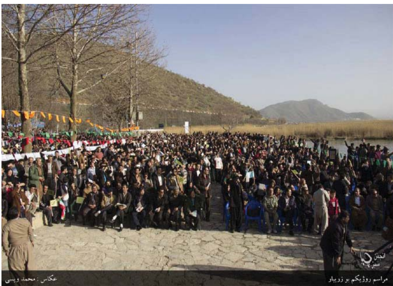
مراسم رۆژگرتن بۆ زۆربار

ئیران، سه ره را ی ئه وه هه مو وه بڤه لگوتنه تی شوڤنڤییه رهنگا و رهنگه کانی به شارستانه تی و مڤژووی و لاته که وه پیشه نگه یه تی ئیرانییه کانی، له رو به ره ورو بوونه وه چاره سه رکردنی پرسى نه ته وه یی و زمانى دا، له دا وه ی هه مو وولاتانى دراوسى خو شڤیه تی، هه مو وولاتانى دراوسى ئیران که له وانیش دا، نه ته وه زمانى جیاوا ییكه وه ده یژن، ملیان بۆ به ره سمش ناسینى زمانه جورا و جوره کانی و لاته که یان و قبو لی مافه کانی تاپه ت به هه ره زما نڤن را کیشا وه. له باره یه وه ده فانین عیراق، پاكستان و نه فغانستان به نموونه بڤنڤنه وه. له عیراق، دوو زمانى كوردی و عه ره بى، هه ره دوویان وه ك زمانى ره سمش له ناستى هه مو عیراق دا ناسرا ون زمانه کانی تورکمانى ئاشوریش له شوڤن ناوچه ی ژبانى ئه وه که مایه تبه نه ته وه ییانه، ره سمیه تیان هه یه. له پاكستان، دوو زمانى ئوردو و ئنگلیسی، زمانى ره سمش سهرانه برین و زمانه کانی په نجابى، به لوچی، په شتون، سڤندى و سرائیک له ناستى ناوچه کان دا، به ره سمش ناسرا ون. له نه فغانستان زمانه کانی ده رى و په شتون هه ره دوویان له ناستى ولاتدا، زمانى ره سمین و گره ملیک زمانى دیکه ش له ناستى هه رمیوه نه یاله تکان دا، به ره سمش ناسرا ون.