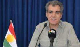
یه‌كێتی لایه‌نی دیموكراتی رۆژه‌لاتی كوردستان سمیناریکی له‌ ژێر ناوی «كۆمه‌لناسیی كۆماری كوردستان و كارپه‌گه‌ری له‌سه‌ر داها‌تووی بزووتنه‌وه‌ی نه‌ته‌وه‌یی» بو ناره‌ش لوستانی به‌رێوه‌ برد.

ئه‌و سمیناره‌ رۆژی شه‌مه‌، 12 به‌فرانبار له‌ بێكه‌ك له‌ سه‌لانه‌ی كۆماری كوردستانه‌وه‌كانی حیزب پێك هات، ناره‌ش باسی له‌ ره‌وتی رووداوه‌كانی پێش كۆمار، سه‌رده‌می كۆمارو باسی له‌ كۆماردا كرتی، له‌ درێژه‌ی قسه‌كانیدا به‌تێر و ته‌سه‌لی باسی له‌ به‌ستینی مێژوویی ئه‌و كاتی رووداوه‌كان به‌ر له‌ دامه‌زرانی كۆماری كوردستان و مللانیی ئێران سوخته‌و مه‌دیینه‌، بزووتنه‌وه‌ی مه‌شهوره‌، كه‌شقی حجاب، لێدانی رێگانسان و كاریگه‌ری له‌سه‌ر بزوته‌ كۆمه‌له‌یه‌تییه‌كان كرد. هه‌روه‌ها كۆمه‌لی ئیگه‌ف له‌ روانگی كۆماریه‌وه‌ نه‌ك هه‌ر ناوه‌ندیكی به‌رتسه‌سی فێكری، به‌لكو به‌ستینییه‌ی هه‌راو بو په‌ره‌ده‌ی كۆماری كوردستان و سه‌ره‌تای ره‌وتی بزووتنه‌وه‌ی سیاسی و نه‌ته‌وه‌یی كورد له‌ شكلی كۆماری كوردستاندا بوو.