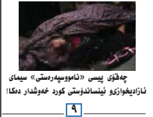
چه‌قۆ یه‌سی «ئامۆسپه‌ره‌ستی» سیه‌می نازادینه‌وی ئیسلامی کورد خه‌وشار ده‌کا!