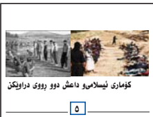
کۆماری ئیسلامی دا‌ش دوو رووی دراویکن

هانتی تیرۆریستی ناسراو محممه‌د جعه‌فر سه‌حراروودی، بکۆژی ده‌قاسملوو شه‌هیدانی دیکه‌ی ١٢ ژوئی ١٩٨٩ی فیه‌ن، له‌ چوارچۆیه‌ی هه‌یه‌تیکی پارلمانی ریزی ئێران بو هه‌ریمی کوردستان له‌ دوا‌رۆژه‌کانی سالی ٢٠١٤ و پێشوازی لیکرانی له‌ به‌رزترین ئاست و له‌ سه‌ر فه‌رشی سوور له‌ سلیمانی و هه‌ولێر، له‌ گه‌ل ره‌خنه‌ و ناره‌زایه‌تیه‌ریه‌ریه‌ی حیزب و ریکخراوه‌ سیاسییە‌کان و چالاکی سیاسیی و فه‌ره‌نگیی رۆژه‌لاتی کوردستان به‌هه‌رووو بو. له‌م‌ باره‌یه‌وه‌ تیکۆشهرانی سیاسیی، نووسهران، میدیاکارانی رۆژه‌لاتی په‌ریوه‌ی هه‌ریمی کوردستان و هه‌نده‌ران، به‌ ئوسین و لیدوان له‌ میدیاکان و تۆرکه‌مه‌لایه‌تییه‌کاندا به‌ توندی ره‌خنه‌یان له‌ پێشوازی ره‌سمی له‌ تیرۆریسته‌ گرت. ده‌یان چالاکی سیاسیی و میدیایی و تیکۆشهری رۆژه‌لاتی ئه‌و توبی «که‌مه‌یه‌تی یه‌کی به‌فرانبار»، نامه‌یه‌کیان روو له‌ سه‌رۆکی هه‌ریمی کوردستان، سه‌رۆکی وه‌زیران، سه‌رۆکی پارلمان و مه‌کتبه‌ی سیاسیی یه‌کیه‌تی نیشتمانی کوردستان بلاو کردوه‌. له‌ نامه‌که‌ دا هاتوه‌: «په‌وه‌ندی دیپلوماسی له‌گه‌ل ئێران، به‌ هۆی سنووریکیی به‌رفراوانی ئێوان هه‌ریمی کوردستانی باشوور، له‌گه‌ل کۆماری