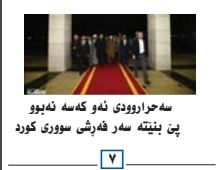
سه‌حراروودی ئه‌و که‌سه‌ ئه‌بوو پێ نیتته‌ سه‌ر فه‌رشی سووری کورد