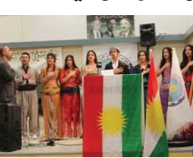
كۆمیسێه‌ی حیزبی دیموكراتی كوردستان له‌ وڵاتی فینه‌لند رۆژی پێشه‌ره‌گه‌ی كوردستان به‌رزی راگه‌رت.

سیاسیی كورد له‌ به‌ئێده‌ی ئێران بو ماوه‌ی زیا‌تر له‌ مانگیت بووه‌ یه‌كێكی سه‌رنه‌و پاسو لێدوانی مێدییا كۆردیه‌یه‌كان توره‌ كۆمه‌له‌یه‌تییه‌كان، له‌ روانگی چاره‌په‌وانه‌و تێشكی خه‌رایه‌ سه‌ر. - ئه‌ندامانی لایه‌نگه‌ری حیزبو رێكخاوه‌ر سیاسییه‌كانی رۆژه‌لات، هه‌روه‌ها چالاکی سیاسیو فه‌ره‌نگیو داكۆكێكاری مافی مرۆف، به‌ رێپێوان و كۆبوونیه‌وه‌ پوهندنگه‌رتان به‌ مییباكان و ناوه‌نده‌ مرۆفۆسته‌كانی جیهان، تاوان سه‌رنجی بیورری كشتی له‌ رۆژه‌لاتو به‌شه‌كانی دیكی كوردستان، هه‌روه‌ها له‌ وڵاتانی رۆژاویایی بو لای باروودۆخی به‌ئێده‌ی سیاسییه‌ كۆرده‌كان له‌ به‌ئێده‌ی ئێران راگه‌شتن و جۆریك كۆشاری مێدیایی و مرۆفۆسته‌نه‌ بو سه‌ر كۆماری ئیسلامی دروست بگه‌ن. - به‌چه‌ند كه‌و، یه‌كێك، شه‌نگیروونی مانگرتن‌ه‌وان له‌ سه‌ر داخوێزانانیان درێزه‌دانیه‌ن به‌ مانگرتن، رۆه‌م: پێگه‌تیی پێش‌نویانییه‌ی روو له‌ زایدبوون بوو مانگرتنه‌كه‌ له‌ ئه‌نجامی ئه‌ندامانی په‌ره‌ده‌ی وڵات، سه‌په‌: راگه‌شتاری سه‌رنجی بیورری كشتیو ناوه‌نده‌ مرۆفۆسته‌كان بو لای به‌ئێده‌ی ئێران و ئه‌نجامی به‌ئێده‌ی سیاسییه‌ كۆرده‌كان، چواره‌: ئیگه‌رائی به‌ئێده‌ی ئێران له‌ كارپه‌گی شه‌وه‌یاریه‌كانی ئه‌م مانگرتنه‌ له‌ سه‌ر كارانه‌ ره‌شو خه‌ش‌ه‌وه‌یه‌كه‌ له‌ باوری مافی مرۆف له‌ گه‌رمه‌ی ئه‌نجامی ئه‌و كه‌له‌ رۆژاوادا، مانگرتنی ئه‌مه‌گه‌رائی به‌ئێده‌ی سیاسییه‌ كۆرده‌كان، به‌ سه‌ركه‌وتینی رێژه‌یی بوو مانگرتن‌ه‌وان مللانی كارپه‌گه‌شتی زیندان بو ئاسته‌گ له‌ داخوێزانانی مانگرتن، كۆتایی به‌ی هات. **