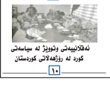
ئه‌قلانییه‌تی و تۆبۆژ له‌ سیاسه‌تی کورد له‌ رۆژه‌لاتی کوردستان