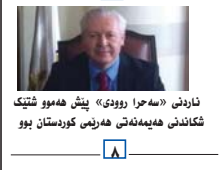
ناردنی «سه‌حراروودی» پێش هه‌موو شتیکی شکاندن هه‌یه‌نه‌تی هه‌ریمی کوردستان بوو