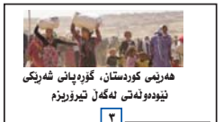
هه ریس کوردستان، گۆره یانی شه ریکی نیو ده ولتی له گه ل تیرۆریزم

نزیکی دوو هه وتوو یه زنجیره یه که چالاکی سیاسی و پشه مه رگانه له ناوچه جیاوازه کانی رۆژه لاتی کوردستان ده ستی یه کرده، ریکه زان و به شدارانی ئه م زنجیره چالاکیانه خۆیان وه ک «پاریزه رانی رۆژه لاتی کوردستان» به خه لکو میدیاکان ناساندوه. له پهی زانیارییه کان، ئه و تیکۆشه رانی نه ته وه که مان له شه وانێ ۲۱ و ۲۲ خه رمانان له ناوچه کانی سه رده شت و مه رپوان، له گه ل که مینه ی به رین و ده سه رژی هیزه چه کاره کانی کۆماری ئیسلامی به ره وره بوو، به لام جگه له تیکه کاندنی که مینه کان، تاونیوانه ژماره یه کێ ۵ که سه له پاسداران و به رگیگراوانی رێژیم بکوژن و ژماره یه کێ زیاتریش بریندار بکه ن. له پاننامه یه که دا که «پاریزه رانی رۆژه لاتی کوردستان» بلاوان کرده ته وه هاته: «... ئیمه له ئامیزی نه ته وه که ی خۆمان هه لقاو لاین. رۆله تیکۆشه ر و ئازادخوازه کانی رۆژه لاتی کوردستانین که وه ک پاریزه ر و به رگیگراکی خه لکی رۆژه لاتی