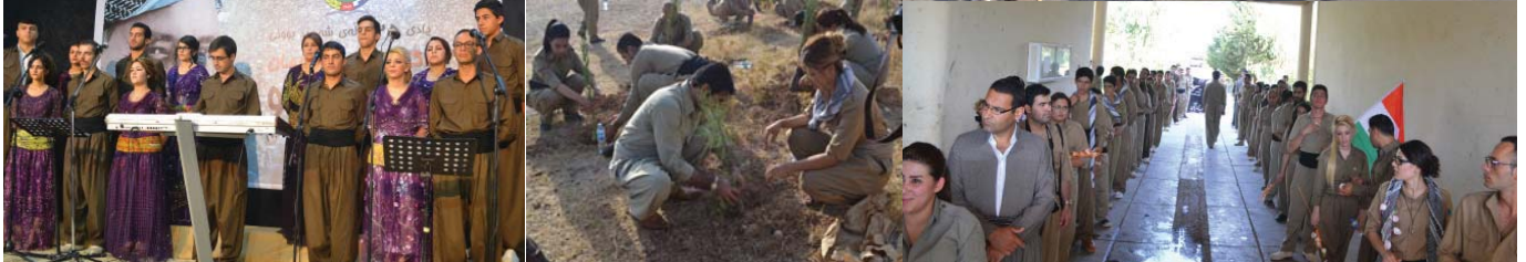
کۆیه - بنگه‌ی دهفتەری سیاسی