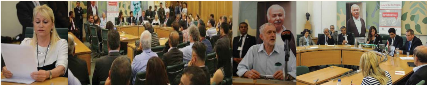
سمینار لە پارلمانی بریتانیا