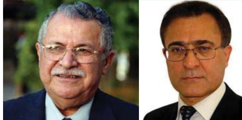
شهریکی شادی و خوشباتین.

به‌ریز مه‌کتبه‌ی سیاسیی یه‌کبه‌تیی نیشتمانی کوردستان! له‌گه‌ل ریز و سلایو دوستانه! له‌لایه‌ی خۆشه‌وه و به‌ناوی ده‌فتەری سیاسیی و رهنه‌یی حیزب و هه‌موو تیکۆشه‌ه‌رانی حیزبی دیموکراتی کوردستانه‌وه، به‌گه‌رمی به‌خیرهاتنه‌وه‌ی سه‌روک مام جه‌لال بۆ کوردستان ده‌کەم. هه‌ر له‌م پێوه‌ندیه‌ دا له‌ قوولایی لاله‌وه‌ پیرۆزبایي و چارو دل روونی له‌ ئیوه و بنه‌ماله‌ تیکۆشه‌ه‌رکه‌ و سه‌رجه‌م هۆگرانو خۆشه‌ویستانی مامی به‌ریز له‌ نیو یه‌کبه‌تیی نیشتمانی، له‌ نیو نه‌توه‌ی کوردو له‌ نیو خه‌لکی عێراق دا ده‌کەین. هیوای من و هه‌موو هاورێنمان له‌ نیو رهنه‌رو تیکۆشه‌ه‌رانی حیزبی دیموکراتی کوردستان، سه‌لامه‌تیی رۆژبه‌روژ زیاتو ته‌مه‌ندریزی مام