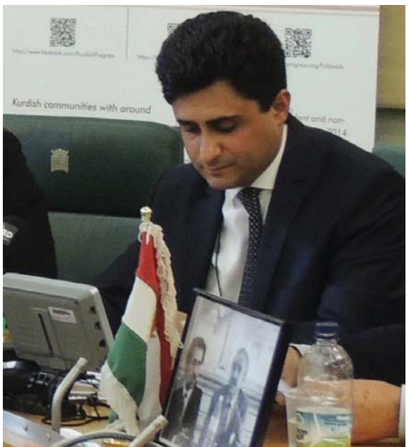
له‌ روژه‌ه‌لاتی نیوه‌راستدا که به‌دهست ئیفراتیگه‌ری و دابه‌شبوونه‌که‌انه‌وه هه‌نجه‌ن هه‌نجه‌ن ببوو، قاسملوو نوینه‌رایه‌تیه‌ی چه‌شینگ عه‌قلانیه‌ت و هاوه‌سه‌نگی ده‌کر

هه‌روه‌ها له‌یه‌که‌مین هه‌له‌ژاردنی پارلمانی پاش ئینقلابی‌شدا به‌شداریه‌یان کرد. به‌لام ریزیه‌ی نوێ هه‌له‌ژاردنی ئەوانی هه‌له‌ه‌شاندوه و قاسملوو بۆخویشی به‌هۆی مه‌ترسی به‌ سه‌رگه‌یانی هه‌ره‌شه‌ی راسته‌وخۆی شه‌خسی نایه‌تولا خومه‌ینی هه‌رگیز له‌ کۆبوونه‌وه‌کانی مه‌جلیسی خۆبه‌ه‌لگه‌دا به‌شدار نه‌بوو. قاسملوو هه‌میشه ریکاچاره‌ی سیاسی