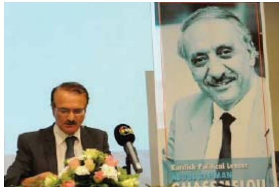
به‌رېزان نوښه‌رانی حېزب و رېکخاوه سیاسیبه‌کان! به‌رېزان کسایه‌تیبه‌ سیاسی، فره‌هنگی، هوڼه‌ری و ګومه‌لایه‌تیبه‌کان! به‌رېزان ټنډامان له‌ایښتوانی حېزبی ډیموکراتی کورستان! به‌شادار یوانی به‌رېزان!