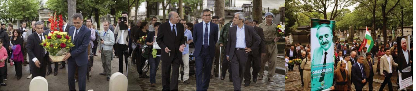
فهرانسە، گۆرستانی پیرلاشیز - سەردانی مەزاری رپۆرەسمەکانی شەهید، دوکتور قاسملوو و دوکتور شەرەفکەندی و ھاوڕێیانان