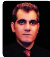
نارمش لورستانی و: ناله‌شین