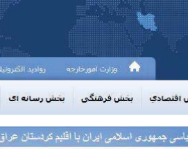
روابط سیاسی جمهوری اسلامی ایران با اقلیت کردستان عراق

کە کۆتایی دا جیتی خۆیتە دستخۆشی لە حکومەتی هەرم بەکەین کە بەرێگای دێپلۆماتیک ئیعترازو نارەزاییەتی خۆی دەربریهو بەلام هەر ئەوه‌ندە وەلام دەرینو پێوستی لەسەر تاک تاکی کورد ریکتکارو کۆمەڵگای مەدەنی لە هەر پارچەیکە لە کوردستان و بە تاییەتی لە باشوور رۆژەولات بە هەر شیوه‌یکە کە بویان دەگۆنجی نارەزاییەتی خۆیان دەرین بۆ ئەوه کوماری ئیسلامی لە ناری نوساییەتی لە گەل کوردو هاوکاری کردنی کورد لە باشووری کوردستان، ئەک خراپ وەرنگرێو یاری بە هەستو ئیحصاسی تاکی کورد ئەکاوە لەو ریکاپوه کوردو نەتەوهو خەلکەکانی چەوسیتتەوهو بە نەزانو نەبووی دانەنی.