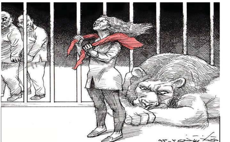
کاری توکا ئێسنانی