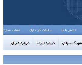
روابط سیاسی جمهوری اسلامی ایران با اقلیت کردستان عراق

لە وتارەکاندا ناتوووه کە دواي رووخانی حکومەتی سەدام ئێران زۆری هەول داوه کە ئارامی لە ناوچەکاندا داوبن بۆ دەلی لە ریزی ولاتە بەکەمکان بوون کە لە شاری هەولێرو سلیمانیە بنگە کونسولگریمان داسەزاندنوه باس لەوه ناکا کە بە پێی یاسا ئێوه‌ولەتییەکان کە لەسەر هەوه بەشیکمان باس کرد کرد ئەوهی ئەو دەقیقەرە و ئێنەراییەتی بەرەزاییتی دوو لایەن دەبی ئەگەر کوماری ئیسلامی مەرۆهک خۆی دەلی بەرژەوه‌ندی ئە ئارامی ناوچەکە دایە حکومەتی هەرمیش هەولی داوه بە کردار ئەو ئارامیە دروست بکا کە زۆرتی لە بەرژەوه‌ندی کوماری ئیسلامی داوه، بەلام ئەوهی لە ماوهی ئەو چەند سالە سلیمانیە ئەک هەولیان نەداوه بەرە بە پێوه‌ندی گەشەسەندنی ئابووری و زانستی بدەن، بەلگوو هەولیان داوه فەرھەنگی کەلک وەرگرتن لە مادە هوشبەرەکان و