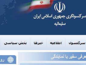
روابط سیاسی جمهوری اسلامی ایران با اقلیت کردستان عراق

کە کۆتایی دا جیتی خۆیتە دستخۆشی لە حکومەتی هەرم بەکەین کە بەرێگای دێپلۆماتیک ئیعترازو نارەزاییەتی خۆی دەربریهو بەلام هەر ئەوه‌ندە وەلام دەرینو پێوستی لەسەر تاک تاکی کورد ریکتکارو کۆمەڵگای مەدەنی لە هەر پارچەیکە لە کوردستان و بە تاییەتی لە باشوور رۆژەولات بە هەر شیوه‌یکە کە بویان دەگۆنجی نارەزاییەتی خۆیان دەرین بۆ ئەوه کوماری ئیسلامی لە ناری نوساییەتی لە گەل کوردو هاوکاری کردنی کورد لە باشووری کوردستان، ئەک خراپ وەرنگرێو یاری بە هەستو ئیحصاسی تاکی کورد ئەکاوە لەو ریکاپوه کوردو نەتەوهو خەلکەکانی چەوسیتتەوهو بە نەزانو نەبووی دانەنی.