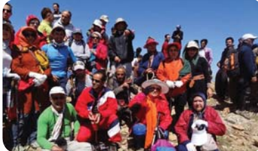
به‌ یه‌که‌مین شار له‌ جی‌هان‌دا ناسرا که‌ به‌ گازی شیمیایی بۆمه‌باران کراوه‌.

له‌ سه‌ره‌ به‌رزاییه‌کانی سه‌ری گۆمی یادی قوربانیانی ۲۷ سا‌ل له‌وه‌ پێشینی بۆمه‌بارانی شیمیایی شاری سه‌رده‌شت به‌رز راگیرا.