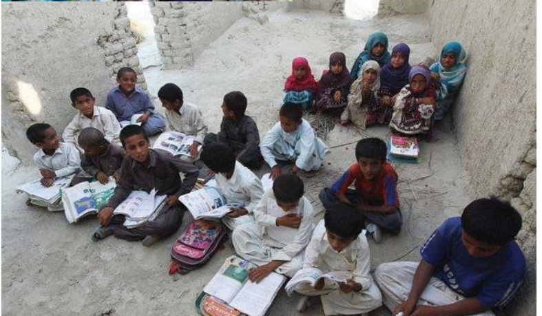
قوتابخانه‌یه‌ک له‌ یه‌کێک له‌ گونده‌گانی سه‌ربه‌ سیستان و به‌لوچستان له‌ نێزان!