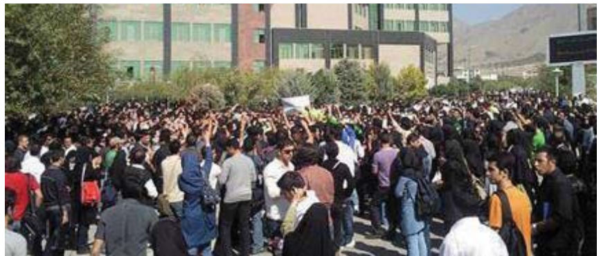
کۆبوونەوهى نارهزایهتی خۆبێدەرانی زاڤۆ «آزاد»ی تاران دژی نازادانی زیندانیانی بەندی ۳۵۰ ئیوی

توانبەدەوهی ئێستە وەگەرنێتە سەر و کە هەر وەک لە سەرەوه باسمان کرد زیندانی مافی هەیه ئەو مافانە بۆ قانون دەست نیشان کراون و