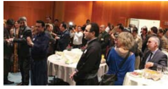
ئه‌وه‌تیا به‌ته‌ئێ ره‌قیب و نه‌ورۆژ لیدرا و له درێژدا هه‌نهرمه‌ند هه‌زار زه‌ه‌اوای به‌ ده‌فۆنڤینگکی جوان سهرنجی به‌شداربووانی بۆ لای خۆی راکێشاو به‌نامه‌که به‌ شادی و هه‌له‌پرکیی به‌شداران کۆتایی پێهات.

رۆژی ۱۶ی مارس ۲۰۱۴ هه‌به‌ته‌تیکي حیزبی دیموکراتی کوردستان پیک هاتبو له کاوه ناغه‌نگهری نوینه‌ری حیزب بۆ کاروباری هه‌یکه‌تیی ئوروپا و سامان ئاراسته‌قهر نه‌ندامی کۆمیتیی بلژیکی حیزبی دیموکرات، له رپۆره‌سمی نه‌ورۆژدا به‌شدارییان کرد که له‌لایهن نوینه‌رایه‌تیی حکومه‌تی هه‌رم له بروکسل و به میوانداریتی نیکولۆ رینالدی نه‌ندامی پارلمانی ئوروپا پیک هاتبو. ئێوه رپۆره‌سمه به‌ چهند قسه‌یه‌کی نیکولۆ رینالدی ده‌ستی پێکرد. ناوبراوی ناوریکی کورتی له مێژووی نه‌ورۆژ دایه‌وه خۆشاله‌لی خۆی به‌ بۆنه‌وی به‌ریه‌وچه‌وونی ئهم رپۆره‌سمه له پارلمانی ئوروپا دا ده‌ربیری. شایانی باسه له درێژه‌ی به‌نامه‌که‌دا مارشی درێژه‌ی: