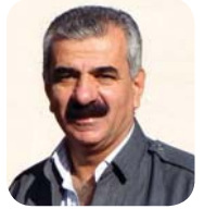
ئاماده کردنی: عومەر باڵه کئی

رووداوهکانی دواي دامهزانی حیزبێ دیمۆکرات ههتا رووخانی کۆماری کوردستان