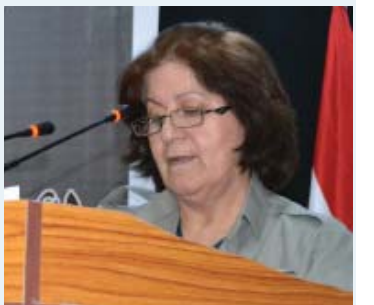
بنه‌ماله‌ی رووسوورو سه‌ره‌به‌ری شه‌هیدان! کادرو پڤشه‌مرگه‌ خۆشه‌ویسته‌کان! هاوریانی به‌رڤز!

ځاځه‌لیئوه له‌لایه‌ره‌کانی مێژووی حیزبی دیموکراتدا به‌ رۆژه‌یه‌سه‌ره‌وان و سه‌ره‌به‌رزان، شه‌هیدان، ناو زه‌د کراوه. به‌ ناوی ئه‌وانه‌ی لایه‌ره‌کانی مێژووی گه‌لی کوردو حیزبی دیموکراتیان به‌ خۆینی خۆیان نه‌خه‌شاندوه‌و سه‌نه‌دی ره‌وابیو بۆنی گه‌لیکی خاوه‌ن شوئاس و پڤتاسه‌ی مۆر کردوه‌و بۆ ئه‌به‌د چه‌سه‌پاندوه. ئه‌وان فڤیری نه‌وه‌ی نوڤان کرد، که بۆ مافی ره‌وا ئڤنسانیه‌ی گه‌له‌که‌مان سه‌ره‌ل‌ری دابڤنو هه‌رز راگریو له به‌رانبه‌ر ده‌ستی بالای ناخه‌بی سه‌ره‌وڤاندا سه‌ر دانانه‌و پڤنڤن و بڤده‌نگ نه‌بڤن. له پیشه‌وای رڤبه‌رو گه‌ره‌ پیاوی کوردو هاوریانی فڤیری جوانمڤیری نه‌ته‌وه‌خۆشه‌ویستی بڤن چۆن بۆ گه‌ل بڤژڤو ئه‌گه‌ر پڤوست بوو بۆ گه‌لیش بمرڤن، ئه‌وه ره‌فاترو کردوه‌وه‌ی جوانمیرانه‌ی رڤبه‌ران و پڤشه‌نگانی بزوتنه‌وه‌ی بوه. له نڤو رڤزه‌کانی حیزبی دیموکراتدا ئه‌و نۆرمه‌ جوانانه بوون به‌ نه‌رڤتیکي با. مه‌رگ ناخۆشه‌ به‌لام له پڤتاو ئاسوده‌یی به‌خته‌وه‌ری‌دا مه‌رگیگ بۆ نڤشتمان بی سه‌د ئڤانی به‌ قوربان بی. هه‌ر له ۱۰ ځاځه‌لیئوه‌دا پڤشه‌وا سه‌رگومارو یارانیان له دار داران تا کڤشه‌ی نه‌ته‌وه‌یه‌که له کوردستان بنڤر بکه‌نو داوا ئڤنسانی و داخوازیه‌یه‌کانی پڤشه‌وا گه‌لی کورد له چال بکه‌ن، نه‌پازناتی مه‌رگی پڤشه‌وا بۆ گه‌لی کورد، ئه‌گه‌ر کۆستڤک و خه‌میکه‌ی گه‌ره‌بڤو، به‌لام نه‌تره‌ی له‌ش بوو، هیژو زڤندوو بوونه‌و په‌کی دوو یاره‌بوو. زه‌نگی و شیاربوونه‌وه‌بوو بۆ گه‌لی کورد که دۆژمنانی نه‌ته‌وه‌که‌ی باش بناسن. له‌و کاته‌وه‌ ۶۷