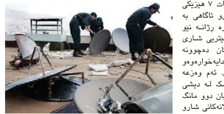
سالار له کامیاران

سه‌ره‌به‌یانی روژی 9/11/92 7 ساعه‌ت 7 هیژیکی زۆر پیکه‌توو له‌ که‌لانه‌ته‌ری، ئه‌ماکنو ناگه‌ی به‌ مه‌به‌ستی کۆکردنه‌وه‌ی دیشی ماهواره‌ ژوانه‌ نیو شارۆچکه‌ی ته‌ره‌وز (له‌ یه‌ک کیلومه‌تری شاری کامیاران) و به‌ی ئاگاداری بوونی به‌مه‌اله‌کان ده‌چوونه سه‌رپه‌ناکان و دیشی ماهواره‌یان فری ده‌دا به‌خواره‌وه‌وه هه‌موویان ده‌هاوێشته نیو ماشینه‌کانیان. ئه‌م وه‌زعه نزیك به‌ دوو سه‌عاتی خایاندو زۆریک له‌ دیشی هاوالاتیان له‌گه‌ڵ خویان برد. مانگیك یان دوو مانگ جاریک وه‌گه‌و ده‌ریک ده‌ریک نیو کۆلانه‌کانی شارو گونده‌گانی ده‌رووبه‌روو زۆریک له‌ دیشی هاوالاتیان له‌گه‌ڵ خویان ده‌به‌ن.