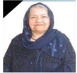
ژێکی نیشتمانه روه ر، مۆقۆدۆست و به مانای راسته قینه ی وشه، گه روه ی له ده ست دا.

له به رنامه ی رۆژی یه که مه ی ئه و فستیواله دا، شه اره داری ناوچه ی هه کتی له لهنده ن به یان سامی عباده رحمان نوێنه ی حکومه تی هه زیمه ی کوردستان له بریتانیا، فه له ک ناز ئه نامی پارلمانی کورد له پارلمانی ته روپیا و، عیسا موسا وه کیلی پینشو ی لسنو ن مه ندالا هه راکام به جیا و تاربان پینچه ک شه کرد و سه با ره ت به پیه ونه یه کانی له گه ل کوردی سینه مای کوردی هه ره وه ها سه ره کو تهنه کانی فستیوال و به ریه وه به رازو پشیتوانانی ئه م پرۆژه یه و هه ره وه ها زیاته ر کار کرد بۆ هه رچه ی با شتر و ده وله مه مند تر کردنی فستیوالی فیلمی کوردی قسه یان کردو پشگیر یی خزیان له کۆمیه تی به ریه وه به ر ی فستیوال ده ره یی. به شیکه ی تری ئه م ئیواره خاوه به شدار ی کۆری تابه تیه تی کچان به ده ف لێدان و هه لپه رکه ی کوردی به ده فۆل و زور نا بوو. فیلمی «پینش بارینی به فر» له ده ره یته ی هیشام زه مان، یه کم فیلمی کوردی بوو که له رۆژی ده ستنیکه ی فستیواله که دا پشانه درا. له و فستیواله که دا به به شدار ی به مه ن قوبادی، هونه سه لیم، هیشام