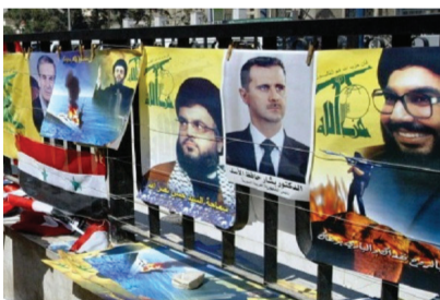
تیکه لچونه كانى سووریه دا ده ربیو باراك ئوباما له م باره یه وه داواى له هاوتای لوبنایى خۆى كرد كه روونکردنه وه ی هه یئ. هه ره ها به پتی راپۆرتى ریکخراوى چاوه دپیری مافى مرۆقى سووریه له پێكدا نه كانى شارى

به پتی راپۆرتى هه والده رى فه رانسو به وه تى دیپلۆماته ئوروپایى به كان، ده وله تى بریتانیا پێشنبارى كرده لكى سەر باری حیزبوللای لوبنان بخریته لیستی تیرۆرى ئوروپاوه و باسو راگۆرپكى رەسمى له م بواره دا، دوو هه وتوى دیکه ده ست پێن ده كا. له لیسته تیرۆر هاویشتنى حیزبوللای لوبنان له لایه ن یه كیه تى ئوروپاوه له حالیکه دا به كه ده وله تى ئه مریکاش حیزبوللای لوبنان به ته شكیلاتیكى تیرۆریستی ده زانیو داواى له ولاتانى جیهان و به تاییه ت یه كیه تى ئوروپا كرده كه ئێم حیزبه توندره وه له لیستی تیرۆریستی باوین. ئه مریکا پێشتر به توندى ناره زایه تى له ده ستیوه ردانى هیزه كانى حیزبوللای لوبنان له