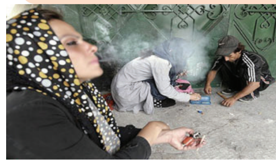
ولاتدا ده‌لێ سه‌دی ۸۰ ی به‌کاره‌ینه‌رانی شیشه‌ ته‌مه‌نیان له‌ نیوان ۱۸ تا ۳۰ ساڵدا.