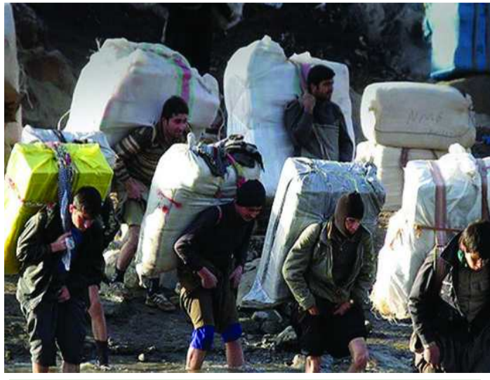
کۆلبه‌ران، قوربانیانی هه‌زاری له‌ کوردستان