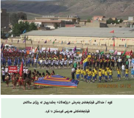
کۆمه‌له‌کی فووتبالییانه‌ی نه‌هه‌یی «رۆژه‌لات» به‌شارنه‌مان له‌ رۆژی سالاخی قه‌یماوه‌کانی هه‌رینی کوردستان دا کرد.

له‌ نوابه‌وه‌ له‌رزه‌که‌ی ئه‌م دوابه‌تیانه‌ی بووشه‌هر، ولاتی عه‌ره‌بیی ئه‌مه‌نی شوواری هاوکاریی که‌نداوی فارس، داوايان له‌ رێکخراوی ئه‌تۆمی ئێران بکا بۆ ئه‌وه‌ی له‌ ئەگه‌ری ژانیه‌کانی نێرووگای ئه‌تۆمی ئێران بکا بۆ ئه‌وه‌ی له‌ ئەگه‌ری ژانیه‌کانی ئه‌م بوومه‌له‌رزیه‌ له‌سه‌ر ئه‌م نێرووگایه‌ دلنیا بن.