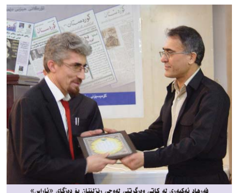
شه‌ره‌اد ئه‌كبه‌رى له كاتى وهرگرتنى لهوحي ریز لىتانی بۆ ده‌زگای «ئاراس»

«ئاراس» و «بنگه‌ی ژین» كۆكرده‌وه و پاراستنى كه‌له‌پوروى به‌لگه‌نامه‌ی و رۆژنامه‌نووسى كوردی و لېكۆلینه‌وه و تیشك خستنه‌ سه‌ریان، له‌و كاره پيوستانه‌ن كه سامانى مژووی كورد و زانیاری تاکه‌كان له‌ سه‌ر رابردوى ته‌وه‌كەیان ده‌له‌مه‌ند