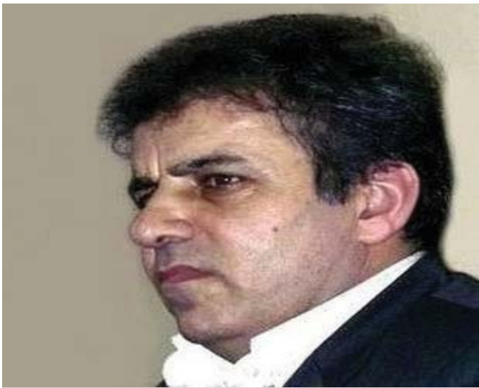
کەبوودەتو، سەرۆکی بەندکرۆی ریکخاوی مافی مرۆفی لە کوردستان

11 سال زیندان حوکم دراوه، لە نامەیکدا که بە بۆنە رۆژی جیهانی مافی مرۆفیوه لە زیندان ناوێتە دەری، بە وردی قاسکی لە سەر ئەو بابەتە داوه و بە رەختەگرتن لەو بێناوە و راگەبەرەوانەیی لەلایەن لایەن