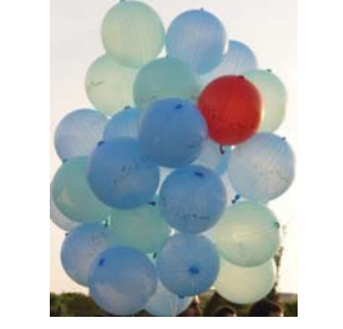
سەرچراکێشدا، بە هاوکاری و بەشداریی منداڵانی رۆژهێڵات لە تاراوگە، دوستو کۆبوو، منداڵانی رۆژهێڵات لەم یادکردنەوه‌پێدا لە پارگی شانەدەر، بە دروشم و نووسینی سەر پەلاکار، هاوسۆزی و هاوهریسی خۆیان لەگەڵ قوتابیانی قوتابخانە سوتاوگەکی شیناوی و بنەمالەکانیان دەربەری

دوانیوهرۆی پێنجشەممە 1397/9/23 بە دەسپێشخەری کۆمەڵیک لە رۆژنامەنووسان و روونکییاری رۆژهێڵاتی کوردستان رۆبەررەسمیک لە پارگی شانەدەر لە شاری هەولێر بۆ هاوپیوندی و هاوخمیی لەگەڵ قوربانیانی کارەساتی سوتانی قوتابخانە شیناوی گوندی شیناوی بەرپۆردەچوو. لەم رۆبەررەسمدا دەیان کەس لە مندالانی بنەمالەکانی حیزبی دیموکراتی کوردستان لە ژێرسەرپەستی ناوئەه‌دە منداڵاریزی رۆژهێڵاتی کوردستان بەشداری بوون. چالاکییەکی ئەو رۆبەررەسمە بریتی بوو لە کۆمەڵیک کارو چالاکی هونەری جوان وەکوو خۆیندنەوه‌ی سرود و پەخشان و پەيامی هاوهرەدی لە لایەن مندالانەوه. لەم رۆبەررەسمدا، کۆزەلە قوتابی ئاشنا گولپەسەندی، پەيامی هاوخمیی و هاوپیوندی ناوئەه‌دە منداڵاریزی رۆژهێڵاتی کوردستانی خۆیندنەوه. پێویستە بوتری ریکخەرانێ ئەم هاوپیوندیە، دیمەنی بۆلی چواری سەرەتایی قوتابخانە شیناوی و قوتابیانی ئەم بۆیان لە نمایشی