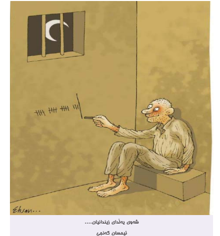
شەوه‌ی بەلەزێ ئێندانیان..... ئێمەمان گەمی

31 کەس لە شاخه‌وانانی ناوچه‌ی سەرەشت بە وه‌سەرکەوتن لە چپای «کەپری» ریزیان لە یادی قوربانیانی کارەساتی ئاورکەوتەوه‌مەکی قوتابخانە شیناوی گرت. رۆژی 24 سەرماوز، 31 کەس لە شاخه‌وانانی ناوچه‌ی سەرەشت