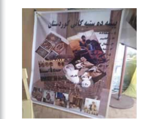
شاعران و نووسەرانی کوردی وەک مامۆستا هێمن، مەستورە ئەردلان و عەباس کەمەندی، موسیقی کوردی، و کتێبی کوردی کە پێک هاتبوو.