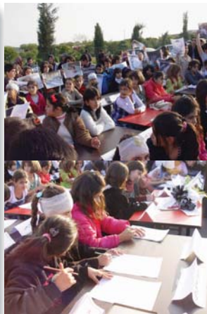
و داوایان لە کۆمەڵاتی خەڵک کرد لە هاوکاری و پشتیوانی قوربانیانی کارەساتە دلتەزینەکانی 5 و 6 سەرماوەزی شیناوی، عاقڵ نەبن.

فێرکردن دەبێت هۆی بەرەوژووربردنی ناستی ژانیاری و تێگەشتن لە ماف و ئازادییەکان و ئەمەش گرنگترین ئامرازێ پەڕیدانی کلتوری پاراستنی مافی مرفۆ. پاراستنی مافی مرفۆ مەرجی پێویستی جێگیربوونی دیموکراسی، ئاشتی و هەماهەنگی کۆمەڵایەتیە. حیزبە سیاسییەکانی رۆژهێڵاتی کوردستان لە بواری فکری و سیاسی و راگەباندن دا، هەر کامێکیان بە کۆیەری نفوز و توانا و باوەره‌کانیان، کەم تا زۆر بە قازانجی جێگەوتنی باوەر بە مافە مۆریەکان، هەولیان داووە. بەلام واژۆکردنی ئەم پەیماننامە، ئەركی ئەوانی لە پێوهندی لە گەڵ کارو تیکوشان لە بواری مافی مرفۆ دا قورستر کردووە. بە تایبەتی پێویستی بە هەموو کات و ساتێکا بۆ پێوانە داوکۆی لە مافەکانی منداڵان و ژنان بکەن. ئەو مافانە لە کۆمەڵگە کوردستاندا بناسین و مرفۆی کورد داڕێژین پابەند بێن بە پاراستنی مافی مافی مرفۆ (ژنان و منداڵان). ئەمە دەتوانی زۆرخاسرێکی مرفۆستانە و ئێنسانی بە خەباتی نەتەوه‌یی، بەدایەنەروەدانە و دیموکراسیخوازی ئەوان بەدا. لەم رۆنگەبەوه، مۆرکردنی پەیماننامەکانی ژێنفاکال لە لایەن حیزبەکانی رۆژهێڵاتی کوردستان، بە هەنگاویکی گرنگ دەزانن.