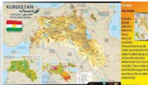
دههینر ی: شه اره کانی «وان، که رکوک، موسل، ئاگری، ورمی، کرماشان، هه ولیر» له شو شاران که له نه خشه ی تازه ی جیهاندا ناویان تومار کراوه.

کو توبه تی له ئاکامی گه ران و پشکنینه کانی نه کانیاندا له کر دی بیستاسو رو ئاویانه شو ئیه واریکی سه ره تای نیشته جیبوونی مرو ف له دوی قو ناغی شه شکه و ئیشینی بئو زنه وه که میژو هه کی بو ١٠ هه زار سال پیش ئیستا ده که ری ته وه. بو ته ی سه رو کی تیه مه که له نیو شه شو ئیه وا ره دا ته می دوو مرو ف و کو مه لیک نامی ری به ر دی ن و ئیکس و پروسکی ئازه لیا ن دوزیوه توه. به بو ته ی به ر یوه به ری شو ئیه واری سلیمانیش نه شو شو ئیه وا ره له سه ر ناسی جیهان ده که نه له په ره نه وه ی بو یکه م چاره شو ئیه واری کراسته وه ی مرو ف له شه شکه وه توه بو نیشته جیبوون ده وو ز ر ته وه.