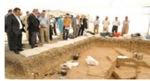
ری دینگی بریتانیا که له ئیستا دا سه رقالی پشکنینی شو ئیه وا ره کانی کر دی «بیس تاسو رو» ن.