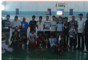
پار یژ گا ی هه ولیر کرد. لوانی کونگ فو کار ی دیموکرات دوا یی دوو روژ چالاکی و مان دو بو یون، توانیا ن به و ده سی هی نانی په کانی یه که م و دو وه می ئه م کبیر کی

تیمکی کونگ فو ی یه که ته یی لوانی روژه لاتی کوردستان به شدار ی له پیش برکی پار یژ گا ی هه ولیرا کرد و توانی به و ده سه ی نانی په کانی یه که م و دو وه می ئه م پار یژ گا یه، سه رکه و تنی به رچا و وه ده سی بیتی. سابتی ناوه نندی یه که ته یی لوانی دیموکراتی روژه لاتی کوردستان بلا وی کر ده وه که، روژی ه شه م مه ریکه و تنی ای ره ز به ری ١٢٩١ ی هه توی تیمکی کونگ فو ی یه که ته یی لوانی روژه لاتی کوردستان، به سه ره رس تی پیش مه ر که ی کونگ فو کار ی حیڙی دیموکراتی کوردستان، سلاح خه لیل به یگی به شدار یان له کبیر کی کونگ فو ی