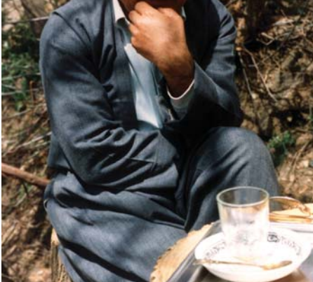
ناوەندى بۆ كۆنگرەى نوێمە

«دیموكراسى دیارە بۆ ژيانى كۆمەلگەى ئینسانى وەك هەوا واپە، بەلام ئینسان ئەتیا بە هەوا نازى و نان و ئاوىش دەوى» (پاشان نامازە و بە لاتانى ئامریكای لاتین دەكا كە 10 سالیگە دیموكراسى لە نێویان دا چێكێر بووه، بەلام هەنگاو بۆ كێشە