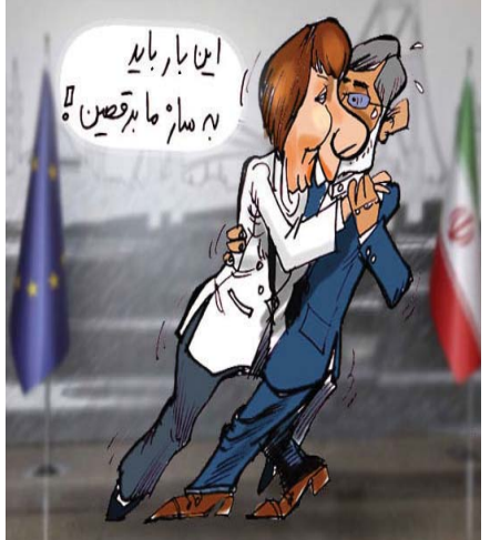
دروزی نیسازو- نیک نایک لهره‌ر

به‌پێی ئاماریکی وه‌زاره‌تی نیوخی تورکیا له‌ ماوه‌ی شه‌ست سالی رابردودا زیاتر له‌ ۲۲ هه‌زار کتیب له‌ تورکیا قه‌ده‌خه‌ کراون. وه‌لی ناگه‌با په‌رله‌مانتاری پارته‌ی گه‌لی کوماری CHP پرسپاریکی بۆ سه‌عدوللا ئه‌رگین، وه‌زیری دادی تورکیا نارووه‌و پرسپویه‌تی له‌ تورکیا چه‌ند کتیبی قه‌ده‌خه‌ کراوه‌ن. به‌لام ئه‌و هه‌یج وه‌لامیکي لا نه‌بووه‌ داوای زانیاری له‌ وه‌زاره‌تی ناوخی کردوه‌ ئاماریکی له‌و باره‌یه‌وه‌ بده‌نی. ئیدریس نايم شاهین وه‌زیری نیوخی له‌ وه‌لامی پارلمانتاریکی پارته‌یکي ئه‌م ولاته‌دا ده‌لی: «له‌ سالی ۱۹۵۲ تا ئیستا بریاری قه‌ده‌خه‌ و راهه‌ستانی چاپ کردن