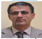
وهلامیک بۆ کۆمیتهی ناوهندی ریکخراوی بهکیهتی فیداییانی گهلی ئێران