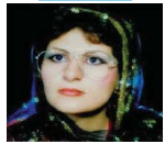
زیلا، کۆنایی بهخشی هیزمۆنی گشتیری یاسوسار له شیخری کوری دا