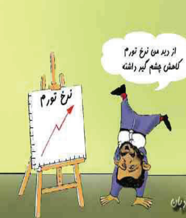
از دید من نرخ تورم کاهش چشم گیر داشته

هه‌روه‌ها ئارش ره‌سافی، بۆ وینه‌گرتنی کورته‌ فیلمی «ئه‌و شووشانه‌ی هه‌لمیان لێ نیشته‌وه‌»