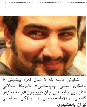
شایانی باسه‌ که به‌ پێی راگه‌باندنی کومه‌تی ئازین ئه‌گه‌رچی تا ئیستا ئهو بریاره‌ جیجی نه‌ کراوه، به‌لام ته‌نانه‌ت له‌ ئه‌گه‌ری جیجی کرائیش دا هینشا ئاسه‌واری ئهو کرده‌وه نامه‌سه‌لانه‌یه به‌ سه‌ر تالاوکه‌ هه‌روا دیار ده‌بی.

به‌شیک له تالووی زیریاب به‌ خاک و خۆل پڕ کراوه‌ته‌وه. به‌ پێی هه‌واڵیک ماله‌ری ئه‌نجومه‌نی سه‌وزی چپای مه‌ریوان له‌ کرده‌وه‌یه‌کی نابه‌رسانه‌ و نامه‌سه‌لانه‌دا ته‌پۆله‌که‌ گه‌ل له‌ به‌رده‌ری چوونه‌ژووریه‌ی تالاوکه‌ رۆ کراوه.