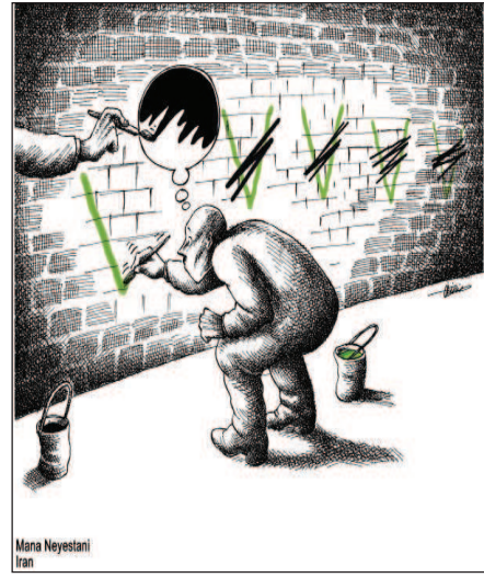
Mana Neyestani Iran

کتابخانه‌ی «ئاسایشی نه‌ته‌وه‌یی و سیستی نیونه‌تووه‌یی» که‌ به‌ره‌می ده‌ جایل روه‌شه‌ندله‌، له‌ لایه‌ن مه‌هدی مه‌هرپه‌روه‌ره‌وه‌ کراوه‌ به‌ کوردی.