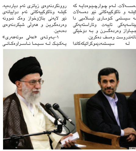
روڼکرډنهوی زیاتری نهو دیاردهی، کیشه و ناکوکیهکانی نهو دواپینانی نیو لایمې بناژخواز وک نمونه ودرهګرن و هولی شپکرتنهوی دودین. ۱-په توتی «علی مونههری» پهکیک له سیما ناسرارهکاتی

و باورهمدانن به وپلايهی قهقیپشی کرتوه. له کوماری نیسلا میا هیلزارډنی نژااد بوننی نییه و دامهزراوه سهړهکیهکانی دهسلا ت له لاپین توپزیکي ټاپهتوه قورخ کراون، بهم هوپه تاکهکانی کومه لکه ناوانن له سر بنهمای هیل و مرچیکي پهکسان لهگل پهکتر یېکنی بکن و هر چاره بهشپنکیان لهریګه بهدهست هینانی دهنگی زورینتهی خهکلهوه له ناوندی برپاراندانا چیګرن. بهام پینه له کوماری نیسلا میا دهسلا ت بهشویهبکی ناشیتپانه و ډیموکراتیک دهستادهست ناګری و نهمهوی نژاد نیو دهسلا ت یو مانوهو چیګریبون و زیاتکرډنی دهسلا تی خویمان له میکانیزم کلی نژاد او نایدولویزیا کلک ودرهګرن و هولی سپرنهوه وهلانای یکتر دههډن. بهوی جهرهوی نایدولویزیکي سیستم و پارادوکسهکسانی نیو یاسای بخرتقی کوماری نیسلا می، خویندنهوی جوراچور و جیاواز و تمنانه تډ بهپک له پیوهډنیهکانی دهسلا ت و پیوهډنی نیوان دهسلا ت و خلك دکسری و نهشم زهمینهی سهړهلالنی کیشه و ناکوکی بخرهډوم، درهخسیتی. به پیچه و نهی ولانانی ډیموکراتیک که لهواندا هر هینزوا لایهکنیک به پشت بهستن به دهنگی خلک یو ماهویهکی دیاریکراو سوکاتی دهسلا ت بخرهډستهوه دهګرن، بهلام له کوماری نیسلا میا دهنگی خلک بهکلاکهروه نییهو لهم نیوه دا کومه لیک میکانیزمی نایدولویزیا و درهوی یاسای زول دهګرن. یو نمونه: بالی موحافیزهکار نه بهپشت بهستن به دهنگی خلک، بهلکوه به کلک و ورګرن له نهمی نایدولویزیاکی «نظارت استصوابی» و ساختمکاری له هیلزارډنهکاندا نیوانی بالی ریغومر خواز له بازنهی دهسلا ت وهلاپنی و ریګهش لهوه بګری که دوپاره بیتپه نار بازنه