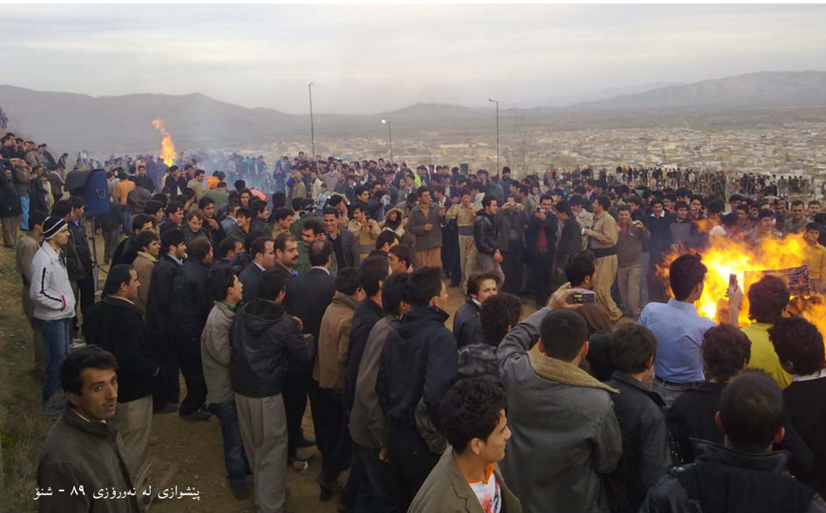
پێشوازی له نه‌ورۆزی 89 - سنو

بهرێز خالیڊ عەزیزی له په‌یامی نه‌ورۆزی خۆیدا، رووبه‌هه‌مسو پێکهاتنه‌کانی کۆمه‌لگه‌ی کورده‌واری رایگه‌یاندا که خه‌بات له پێناو دیموکراسی و رزگاری نه‌تووبی نه‌رکی هه‌مسو تاکیکی کورد و جۆراوجۆرییه‌کانی کۆمه‌لگه‌ی کوردستانیش ده‌توانی هاندەرێکی به‌هێز بێ بۆ به‌ره‌پشێردنی خه‌باتی نه‌تووبه‌تیمان.