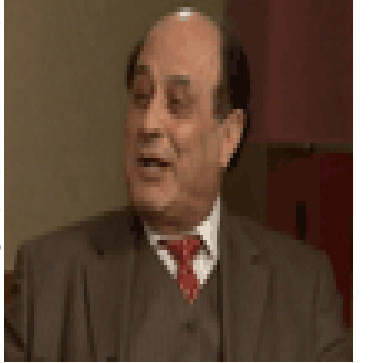
مايه و گوه ريكن

له پيوهندي له گه ل دستدرېژيه جينسيه بهر بلاوه كان له زيندانه كانى ئيرانداو ريگه كانى چاره سهري نهو كه سانه ي دستدرېژيان كراوته سهري، نووشين شاروخى له گه ل ناولبرو و نوويژيكي كرده كه نه مه وهر گيردراوه كه يهنى: